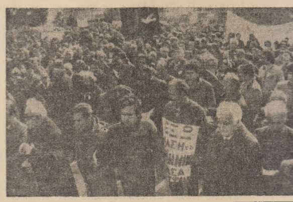
Joi, guvernul Greciei a anunțat că negocierile cu Statele Unite în legătură cu înnoirea acordului asupra statutului bazelor militare americane de pe teritoriul elen au fost suspendate, potrivit relatării agenției France Presse.

Aceste date au fost reevaleate în cadrul reuniunii reprezentanților camerelor de comerț din țările Africii, gazei taxaminează posibilitatea unui schimb de mărfuri mai larg între statele continentului, precum și propunerea înființării unei federații a camerelor de comerț africane.