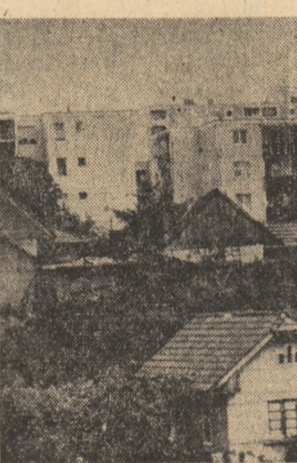
Tirgu Mureș — un oraș în plină dezvoltare