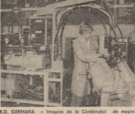
R.D. GERMANIA — Imagini de la Comitetul de mășini-unelte „Herbert Wankel” din Erfurt