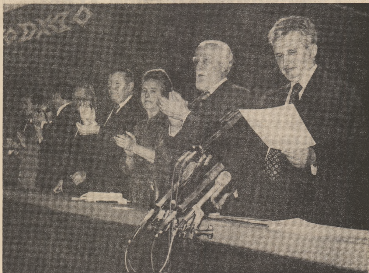
Desfășurate sub președinția tovarășului NICOLAE CEAUȘESCU, secretar general al Partidului Comunist Român, președintele Republicii Socialiste România, președintele Consiliului Național al Oamenilor Muncii, vineri s-au încheiat în Capitală lucrările celui de-al II-lea Congres al consiliilor oamenilor muncii din industrie, construcții, transporturi, circulația mărfurilor și finanțe.

Despre concluziile asupra tuturor propunerilor vom informa, prin intermediul consiliilor oamenilor muncii, toate colectivele de oameni ai muncii, atât în legătură cu propunerile care au fost reținute și care vor fi aplicate, cit și asupra acelor care s-au considerat că nu pot fi reținute, arătînd și de ce n-au fost reținute, spre a fi