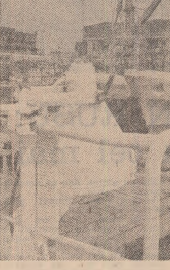
R.D. Germană — Imagine de la șantierul naval din Strasburg

Într-o imagine de la șantierul naval din Strasburg