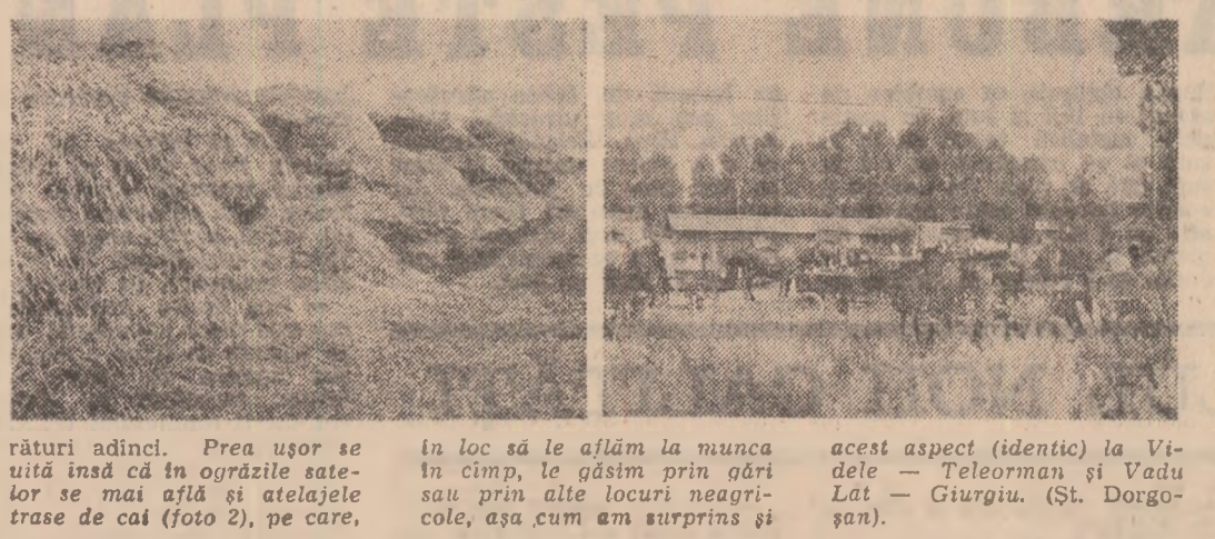
rături adînci. Prea ușor se uită însă cînd în ogăzile satele se mai află și atelejate trase de cal (foto 2), pe care, în loc să le aflăm la muncă în timp, le găsim prin gîri sau prin alte locuri neagricole, așa cum am surprins și acest aspect (identic) la Videla — Telemann și Vadu Lat — Giurgiu. (St. Dorgoșan).

Unul din cele mai des invocate motive pentru care în timp se mai află încă destule pale (sub diverse forme: căpițe, baloți, nebalotate) este lipsa mijloacelor de transport (foto 1). Din cauza acestor „mijloace de transport”, prin care unii gospodari înțeleg exclusiv autocamioane sau tractoare cu remorci, multe unități nu și-au realizat o serie de importanți indicatori ai producției din compania de vară: însămînțarea culturilor succesive și asigurarea bazei furajere și efectuarea programelor de a-