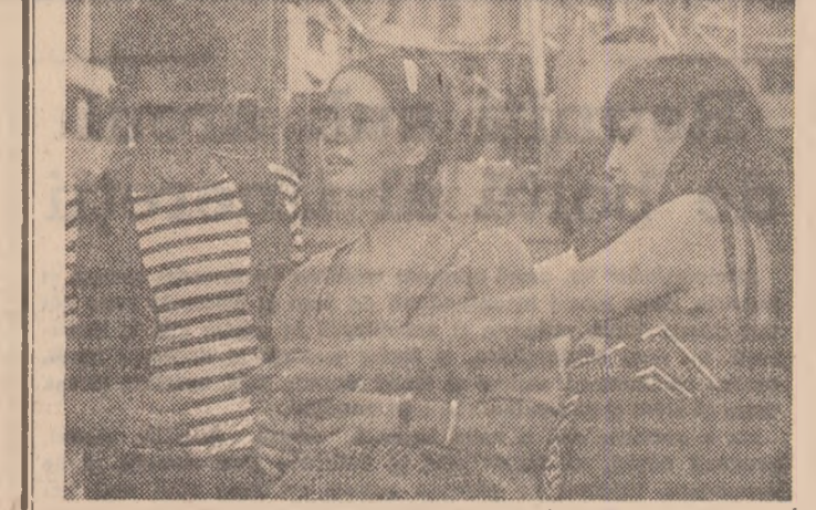
„Fata morgana”, un film în care iubirea este personajul principal