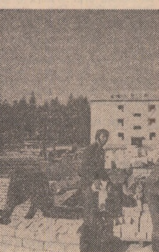
U.R.S.S.: Studenții ai Universității din Minsk participând la construirea unor noi locuințe în orașul Kostomița

Participanții vor examina, totodată, posibilitățile de depășire a divergențelor în domeniul pescuitului dintre Piața comună, pe de o parte, și Norvegia, Suedia și Canada, pe de altă parte.