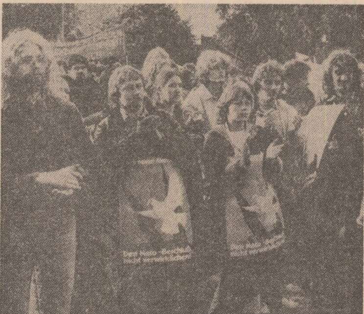
R.F. GERMANIA : Un număr tot mai mare de vest-germani, cu opinii politice diferite, protestează împotriva hotărârii N.A.T.O. privind staționarea de noi rachete nucleare în Europa occidentală. În imagine : Un aspect de la manifestația de protest desfășurată în fața bazei americane de rachete de la Arsbek din R.F.G.