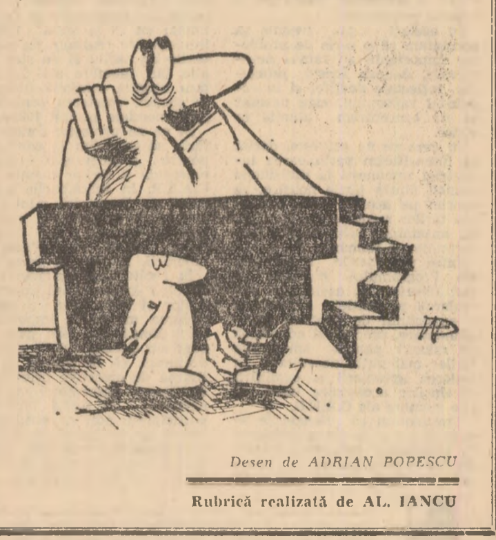
Desen de ADRIAN POPESCU