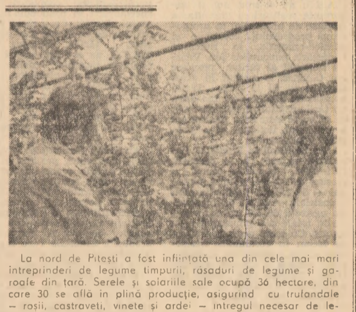
La nord de Pitești a fost înființată una din cele mai mari întreprinderi de legume timpurii...