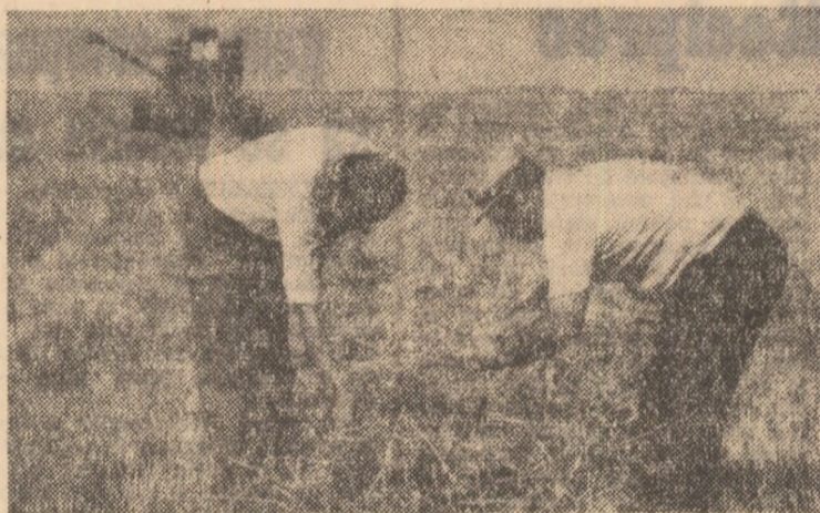
Controlul calității secerișului stă permanent în atenția specialiștilor de la I.A.S. Titu