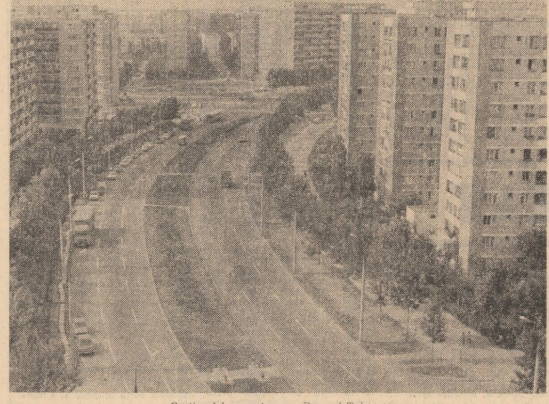
Cartierul bucureștean — Drumul Taberei.

SATISFACTIA IZBINZII DEPLINE Final de seceris în consiliul unic Poiana Mare. În bucărele combinelor ce împinzese lanurile cooperativelor agricole „Timpuți Noi“ se adună ultimele cantități de recoltă. Practic, încheierea secerișului corespunde cu adăpostirea producției și livrarea integrală a cantităților contractate la fondul centralizat al statului. De pe cele 2.330 ha s-au strins în medie la hectar cîte 4 tone de grâu. Planul de producție este astfel îndeplinit în totalitate. Cel 34 combineri se pot lauda cu „o scurtă vară fierbinte“ înregistrând cea productivitate ce le-a permis să finalizeze secerișul grâului în mai puțin de 10 zile. Este aceasta, așa cum sub-