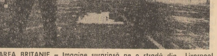
MAREA BRITANIE — Imagine surprinsă pe o stradă din Liverpool în aceste zile

BEIRUT 10 (Agerpres). — Avioane militare israeliene au bombardat vineri localitățile situate între Nabatiyah și Zahranî, din sudul Libanului, transmit agențiile internaționale de presă. După cum precizează agenția W.A.F.A. raidurile au vizat cele două partide convenit cu prilejul vizitei tovarășului Nicolae Ceaușescu, secretar general al P.C.R., președinte Republicii Socialiste România, la Luanda, în aprilie 1979. Totodată s-a exprimat dorința dezvoltării în continuare a acestor raporturi. S-a efectuat, de asemenea, un schimb de păreri cu privire la unele probleme internaționale actuale, deosebit de referitor la situația din Africa Australă. Interviul s-a desfășurat