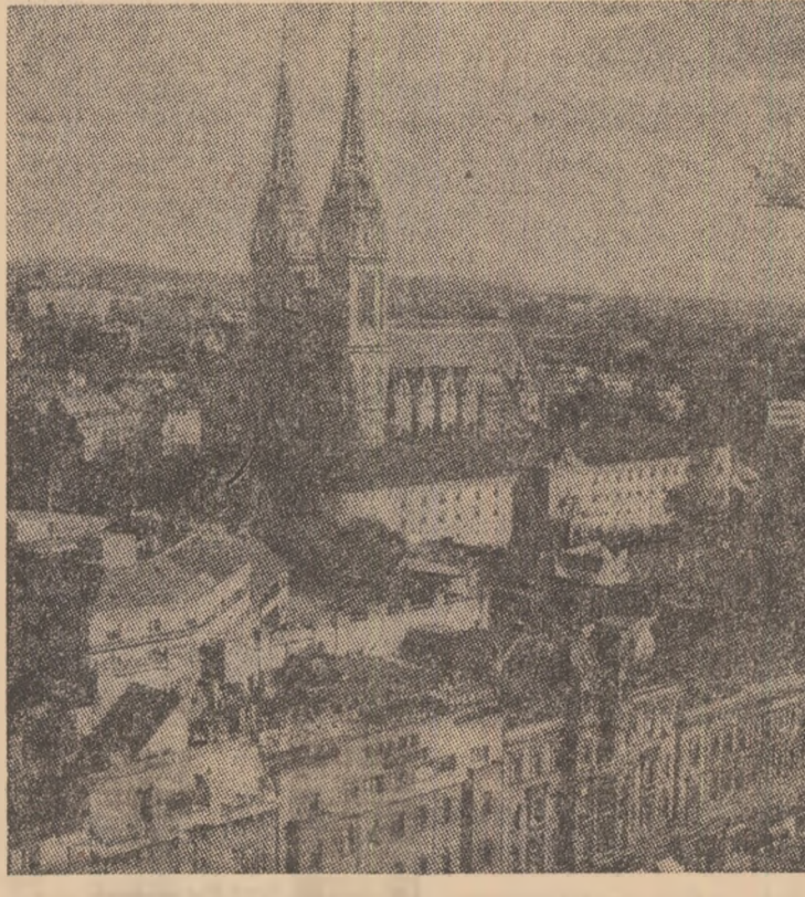
R.S.F. IUGOSLAVIA — Imagine din Zagreb, vechi centru urban, în prezent un oraș de referință pentru dezvoltarea industrială a țării

Statisticile evidențiază, de asemenea, gravitatea șomajului în rîndul tineretului. Aproximativ 36.000 persoane, avînd între 16 și 24 de ani se află în căutarea unui loc de muncă, ceea ce reprezintă 5,2 la suta din totalul tinerilor din respectiva categorie de vîrstă. Se constată astfel o agravare bruscă a fenomenului șomajului față de situația din luna mai a.c. cînd erau înregistrați 27.000 șomeri tineri. (4,1 la suta din populația în vîrstă între 16 și 24 de ani).