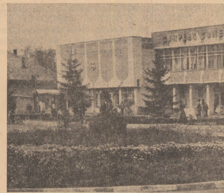
Complexul comercial „Stejarul” din Videla

Patria — metaforă tutelară a muncii și creației noastre Patriotismul revoluționar, patriotismul faptei creatoare (Pagina a 2-a)