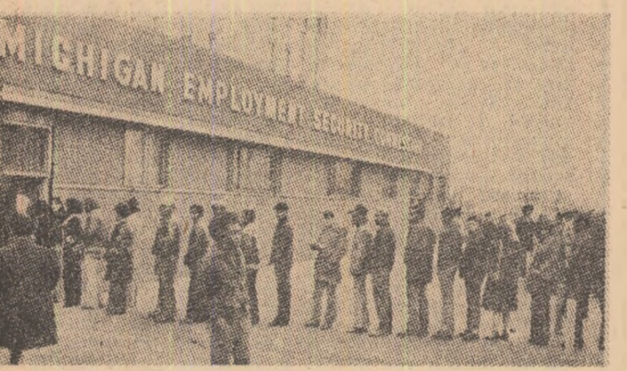
S.U.A. — Șomerii așteptând în fața unei firme industriale, în speranța găsirii unui loc de muncă

TODOR JIVKOV , secretar general al C.C. al P.C. Bulgar, președintele Consiliului de Stat al R.P. Bulgarie, a avut o întâlnire cu Ezekias Papaioannou, secretar general al Partidului Progresist al Oamenilor Muncii din Cipru (AKEL), care se află la dăină în R.P. Bulgarie. În cursul convorbirii au fost discutate probleme ale relațiilor dintre cele două țări, ale misiunii comuniste și muncitorești internaționale și s-a examinat dorința părților de a se dezvoltă în continuare relațiile dintre cele două țări — anunță agenția bulgară de presă, B.T.A.