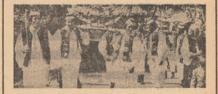
Maramureșul este în toate anotimpurile o poartă spre cer. O poartă a sufletului, a statorniciei și a tradițiilor. Oameni acestui fel se exprimă cel mai bine prin sărbătorile pămîntului și ale apelor...