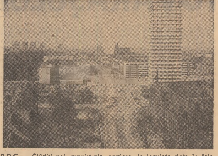
R.D.G. — Ultimei noi, magistrale, cartiere de locuințe date în folosință în Clujului ai acțiunii această imagine reprezentativă pentru ceea ce este în prezent orașul Frankfurt pe Oder