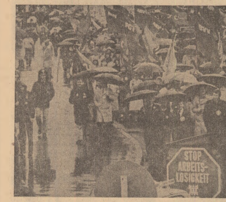
Aspect din timpul unei recente manifestații organizate la Luxemburg, din inițiativa sindicatelor, în semn de protest față de accentuarea șomajului în țările Pieței comune, a lipsei de locuri de muncă și a inflației

Potrivit declarației comune, la congres ar urma să participe reprezentanți ai partidelor politice și organizațiilor din Nord și Sud și personalități democratice din străinătate în vederea constituirii unui comitet proțăitor al întemeierii Republicii Confederale Democratice Koryo și realizării unei largi colaborări în domeniile politice, economic, cultural și militar între Nord și Sud, potrivit noilor propuneri de reunificare a patriei avansate de Kim Ir Sen, secretar general al C.C. al P.M.C., președintele R.P.D. Coreene. Congresul — pivotal unei mișcări naționale în favoarea reunificării — ar putea discuta proiectul de constituire a Republicii Confederale Democratice Koryo și toate celelalte propuneri pentru reunificare, probleme realizării colaborării dintre Nord și Sud în diverse domenii, relevă A.C.T.C. Subliniînd necesitatea unui dialog preliminar convocării congresului, autorii declarației relevă: „În vederea unui asemenea dialog sîntem gata să luăm contact, cu indiferență cine din Coreea de Sud ori din străinătate, în afară de clica Chun Du Hwan, și vom lăsa întotdeauna deschisă ușa dialogului.“