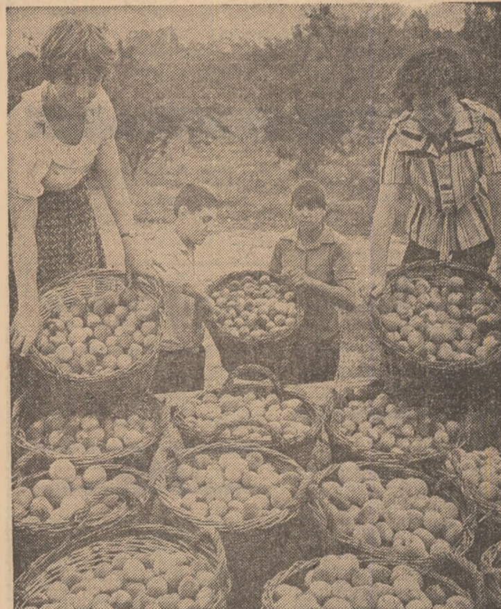
Ceea ce întreprind tinerii la ferma pomivitică a cooperativei din Gherghita este elocvent și pentru alte zone din județ. Mai exact, în peste 20 de tabere de muncă patriotice, la I.A.S. Tohani sau Valca Călugărească, la Dealul Mare sau Uriași se desfășoară acțiunile de sezon la care au fost cuprinși circa 4.500 de elevi și studenți. Și reținem totuși că numai de la Gherghita echipele de tineri culeg și livrează zilnic către piață cîte zece tone de perisici.

În aceste zile premergătoare mării noastre sărbători naționale de la 23 August, oamenii muncii din agricultură depun eforturi susținute pentru efectuarea la timp și de calitate a unor importante lucrări de sezon. Lărgit front al muncii pe ogoare cuprinde acum numeroase forțe tinere, elevii și studenții, toți tinerii satelor angajîndu-se să înscrie în cronică activitățile agricole realizări remarcabile. Veștile sosite la redacție relevă tocmai ampla angajare a tinerilor în executarea lucrărilor prioritare, cea mai mare atenție acordîndu-se recoltării și livrării legumelor pentru buna aprovizionare a populației. În grădini și livezi, în lanurile ce-și pregătesc rodul toamnei, peste tot acolo unde cîmpul solicită mina gospodărilor, organizațiile U.T.C. au deschis șantiere ale recoltei unde tinerii desfășoară intense acțiuni productive în interesul nostru, al tuturor. Toate acestea se însoțesc în stîngerea unor însemnate cantități de legume și fructe, intensificarea activității de irigare neîntreruptă a culturilor aflate în faza maximă a consumului de apă, eliberarea terenurilor și pregătirea viitoarelor recolte.