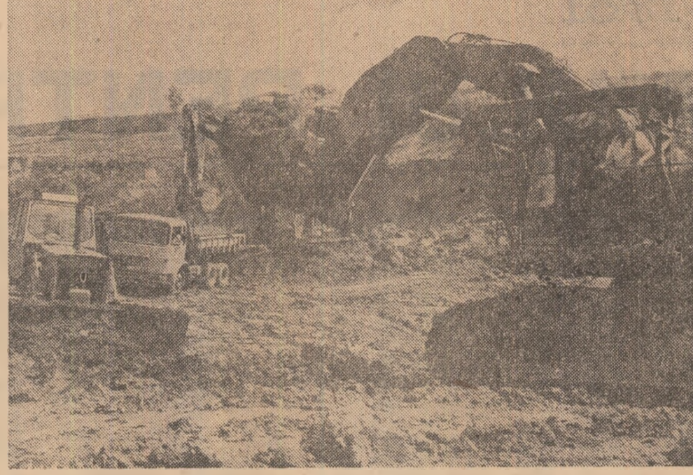
Șantierul național al tineretului de la Combinatul minier „Oltenia” — un loc în care elevii devin pentru toată viața oameni adevărați