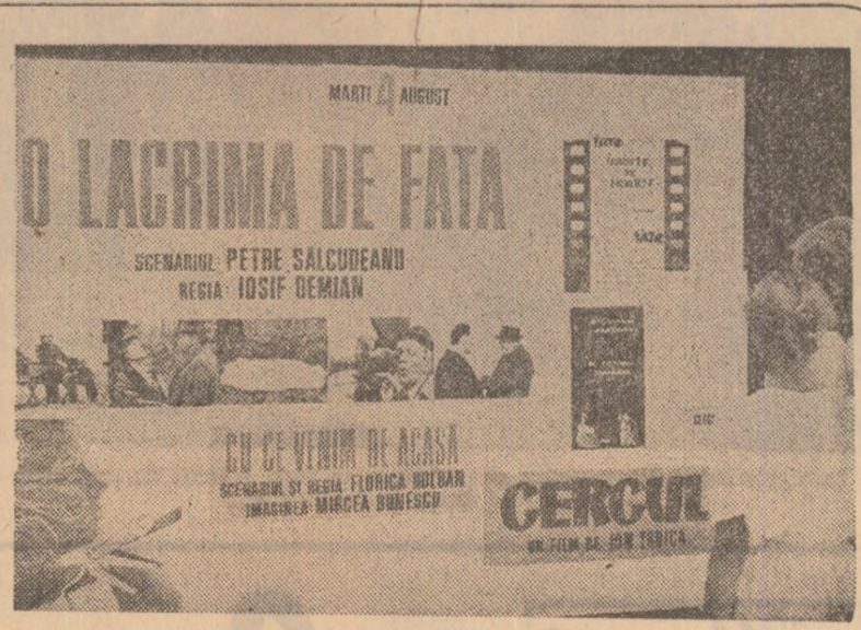
Introducere la Marele Premiu