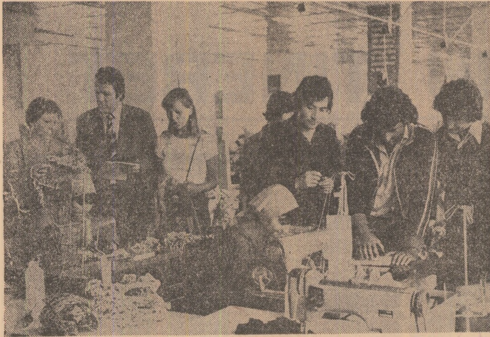
La întreprinderea de confecții din Craiova se face schimb de experiență în materie de finete a feșturilor...