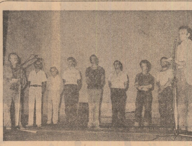
Un moment festiv: prezentarea realizatorilor