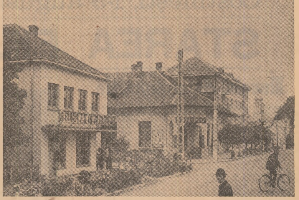
În comuna Poiana Mare orizontala mănoasă a cimpului se completează cu verticala arhitecturii citadine