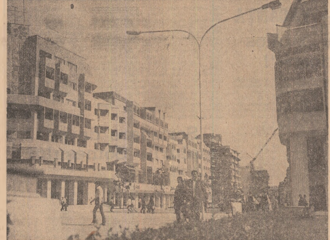
Centrul Craiovei a reînscut din moloz, cu o înflăcărânte de fantezie, de modernitate, de tinerețe

File din jurnalul de călătorie al tinărului scriitor Oameni, livezi și cărbuni în Țara Oltului (În pagina a 3-a)