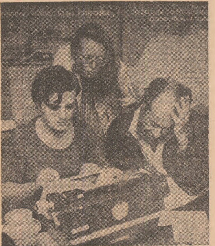
O secvență din redactarea „Secvenței”