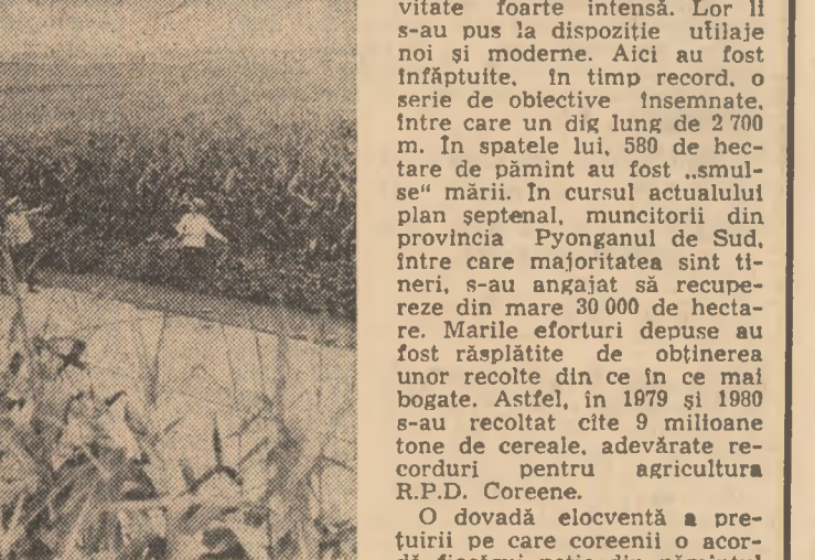
Insemnări din R. P. D. Coreeană

de îngrășăminte chimice în funcție de culturi, s-a înfaptuit irigațiile terenurilor destinate orezului. Dealtfel, agricultura a cunoscut o puternică modernizare și dezvoltare în întreaga țară. A fost realizată o întinsă rețea de irigații, care a prins trupul țării într-un adevărat bria de ape. Pentru alimentarea cu apă a zecilor de mii de kilometri de canale de irigații, au fost construite numeroase rezervoare de diferite mărimi. Pe de altă parte, a sporit cantitatea de îngrășăminte chimice utilizate. Astfel, în 1979, pe fiecare djungbo (un djungbo este egal cu 0,90 ha) s-au folosit circa 1,5 tone de îngrășăminte chimice. O atenție tot mai mare s-a acordat sporirii suprafeței agricole a R.P.D. Coreene. Acest lucru se dovedește a fi deosebit de necesar, dacă se are în vedere că circa 80 la sută din teri-