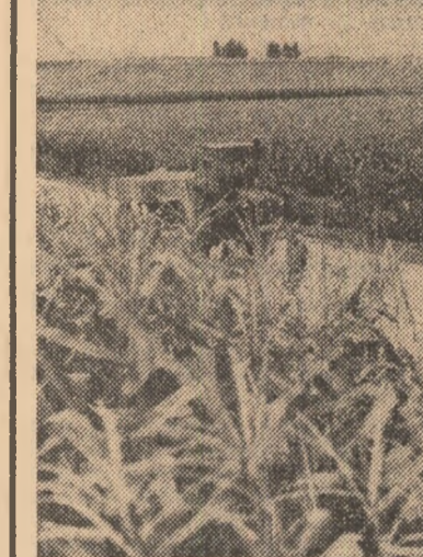
Insemnări din R. P. D. Coreeană

rează, obiectivul călătoriei mele din acea zi, mi s-a părut scurt. Gazele m-au împins cu multă căldură. Discuția s-a înfiripat ușor. Tinerii prezentați la această întîlnire mi-au vorbit cu multă mîndrie despre realizările cooperativelor din care făceau parte. Astăzi mi-a fost însă în mod deosebit atrăgătoare de unul din bătrînii satului. Cu o voce domoală el a început să-și depene șirul amintirilor. Toți ceilalți au tăcut pentru a-l asculta cu multă respect. „Mulți oameni din sat, spunea el, au murit în timpul războiului. Începutul a fost tare greu. În octombrie 1954, data constituirii cooperativei agricole am reușit să aducem în producție cereale. O atenție tot mai mare s-a acordat sporirii suprafeței agricole a R.P.D. Coreene. Acest lucru se dovedește a fi deosebit de necesar, dacă se are în vedere că circa 80 la sută din teri-