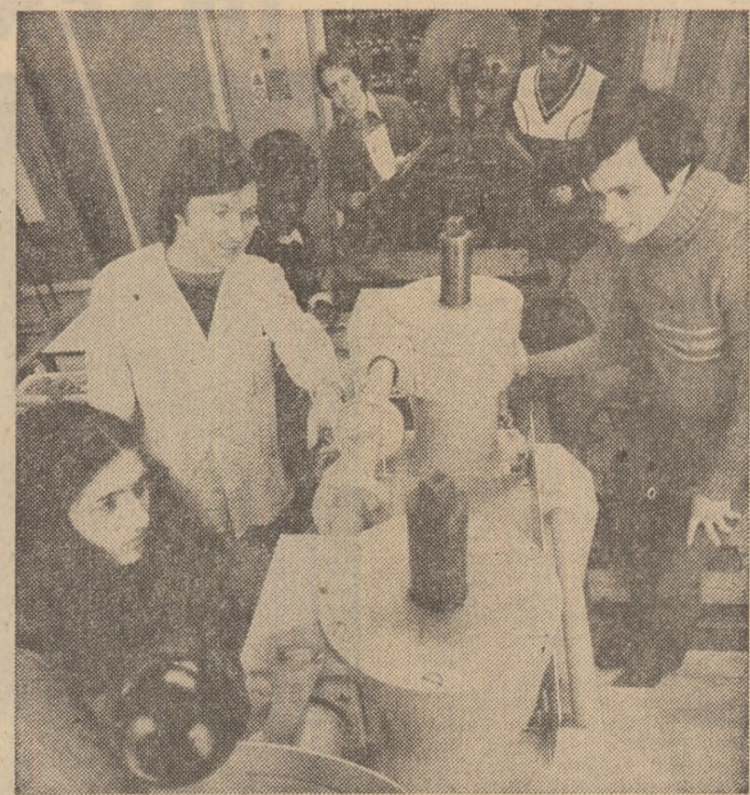
R.S. CEHOSLOVACA: Aspect din timpul unei ore de practică a studenților de la Facultatea de metalurgie din cadrul Institutului de minerit de la Ostrava

Referindu-se la politica externă a țării noastre, agenția de presă turcă afirmă că România pentru dezvoltarea unor relații de strînsă colaborare cu țările din Balcani, eforturile în vederea încheierii reuniunii de la Madrid pentru securitate și cooperare în Europa cu rezultate pozitive. De asemenea, se arată că România acționează pentru oprirea cursei înarmării nucleare, pentru soluționarea tuturor conflictelor internaționale numai pe calea negocierilor, pentru instaurarea unei noi ordini economice și politice internaționale.