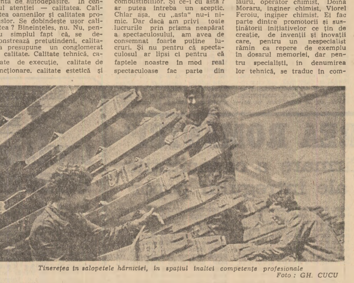
Tineretea în salopetele hărniciei, în spațiul înalt al competenței profesionale.

gescu și Jean, fiul lui Ion de Nicolae ȘT) completează aflișul teatral al spectacolului prevăzută și un recital dat de Tudor Gheorghiu. Un spectacol de sunet și lumină va fi zi de zi prezentat sub titlul Popas în istorie. Montarea și distribuția aparțin Teatrului Giulești.