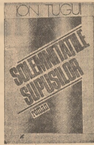
ION TUȚU: Solemnitățile supușilor, Editura Cartea Românească

nească datorită. În loc să analizeze însă autentic o asemenea dubă, profundă dramă sufletească, Ion Tuțu ne transcrie cîteva din cugetările lui Ieronim Vicoavan privind de pildă, „trisericitea beligerantă” (17). În altă parte mi se vorbește tot așa, mai mult enunțîndu-se concepțe a căror denumire numai atrăgătoare nu este, despre „trisericitea (1117) măiestriei disrugerii” în sfîrșit, iată o altă cîntare a lui Ieronim Vicoavan inclusă în conceptul „Imuabilele harababurii în corelație fenomenologică cu necesitatea de a nu clarifica a treia forță din solemnitățile supraviețuirii”. Este foarte greu să lîm un filosof în serios — iar în contextul dat Ieronim Vicoavan dacă nu este luat ca filosof, în serios nu poate fi luat nici în serios ca personaj, de dimensiunea profunzimei cugetătorului depinzînd aici profunzimea personajului însuși — cînd găsim niste formulări amintind imediat de Marius Chicos Rostogan.