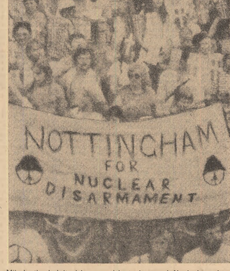
Mii de tineri britanici au participat, în orașul Nottingham, la o demonstrație de protest împotriva escaladării cursei înarmării

COPENHAGA 2 (Agerpres) — Ministrul afacerilor externe al țărilor nordice — Danemarca, Finlanda, Islanda, Norvegia și Suedia — au început miercuri, la Copenhaga, o reuniune de două zile. În centrul discuțiilor se află problemele dezarmării și creării unei zone denucleezată în nordul Europei, precum și situația din Africa australă.