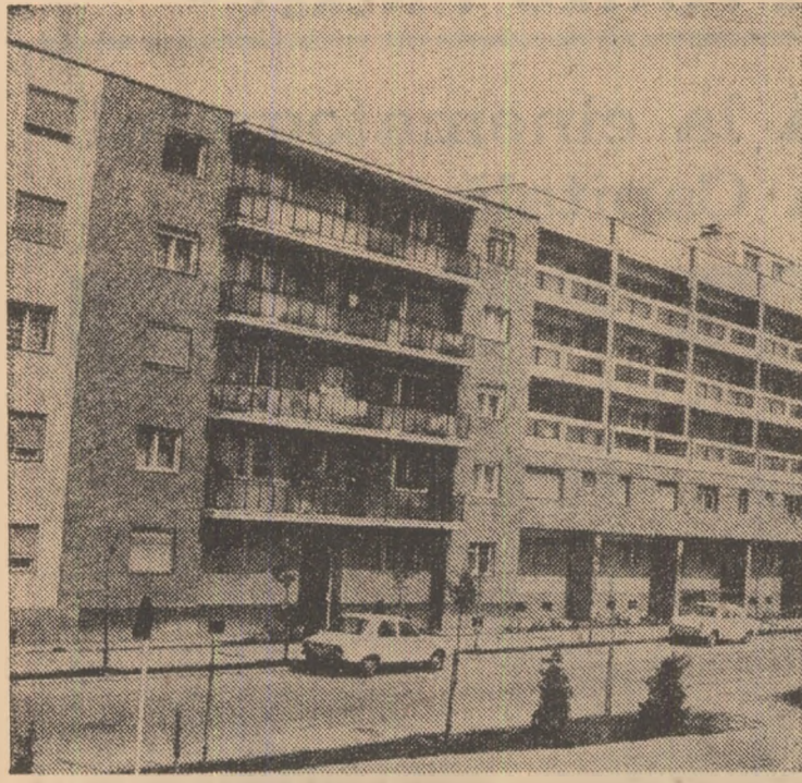
Construcții noi în cartierul Pasaj Micăleca din Arad