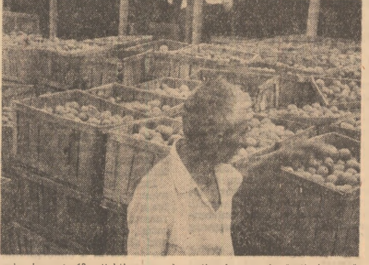
...și cele peste 12 mii kilograme de roșii culesse cu două zile în urmă, dar nepreluate de către C.L.F.