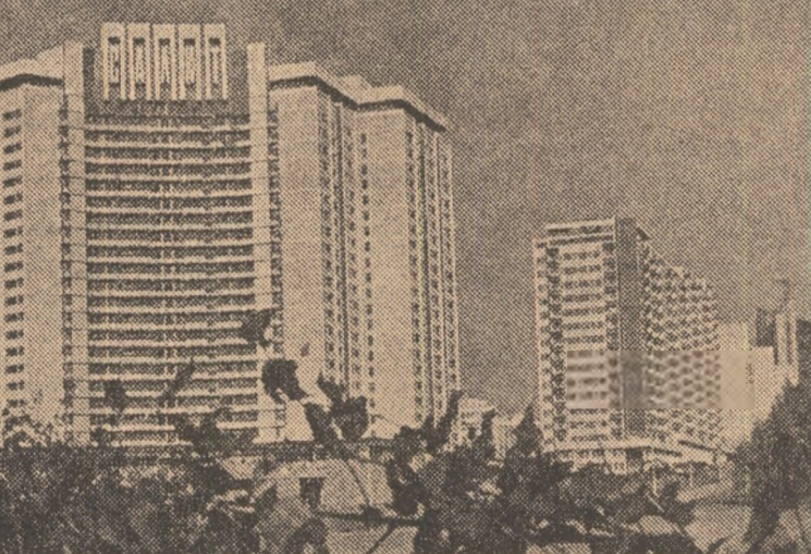
U.R.S.S.: Noi blocuri de locuințe ridicate în ultima perioadă în capitala sovietică

Proiectul va fi supus spre examinare Bundesratului, care își va inaugura sesiunea de toamnă săptămîna viitoare.