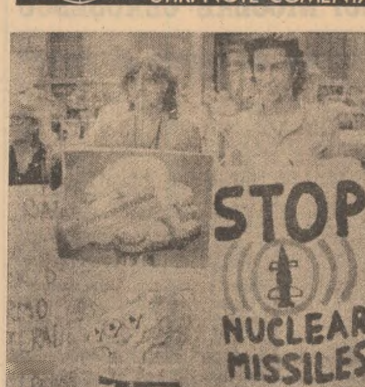
ITALIA: Aspect de la o demonstrație împotriva hotărîrii S.U.A. de a produce bomba cu neutroni, desfășurată în fața clădirii Parlamentului din Roma