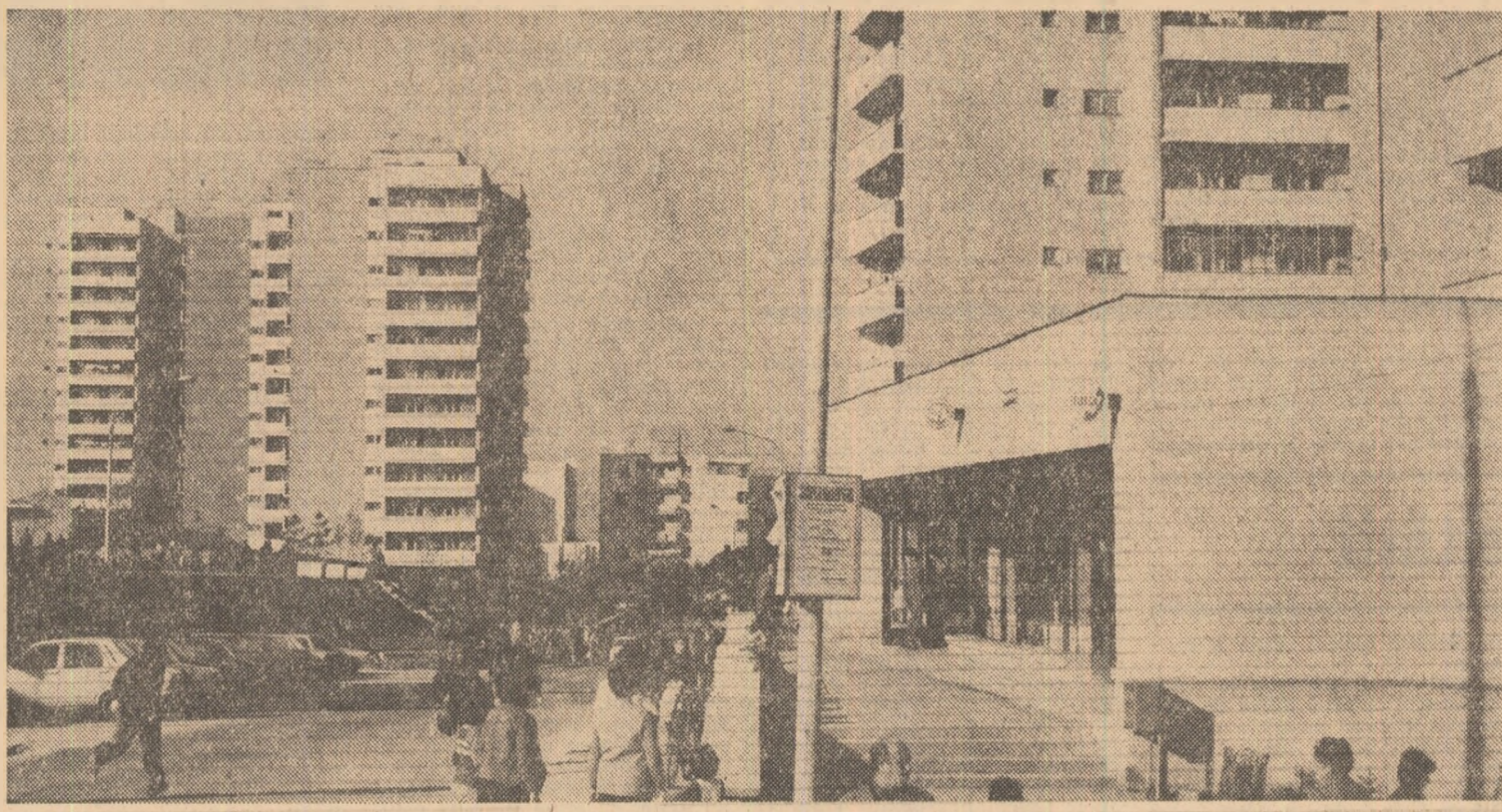
Din noua arhitectură a municipiului Sf. Gheorghe

La secția Cooperăției de consum pentru prelucrarea argilei în vederea obținerii vestitelor vase de ceramice prezentele vase de ceramice de Marginea nu au găsit primeni. În atelier era răcoare și miroase a fum, a petrol și a lut ud. Dintr-un difuzor, o voce caldă de bărbat cînta „Du-mă acasă, măi, tramvai”. Pe Jos, lut; de-a lungul zidului de la fereastra din prima încăpere, citeva roși ale aralului; două sortiri ce urme de degete murdare de lut șterse cu grabă; o pereche de pantofi vechi; două vase cu apă și cu bureți în ele pentru spălat de mîini; resturi de argilă frîmțată pe prierul servind de masă; o oală mică șterbită pe o bucată de scindură... Lumina după-amiezii de august ploiește și rețe se filtra cu discreție