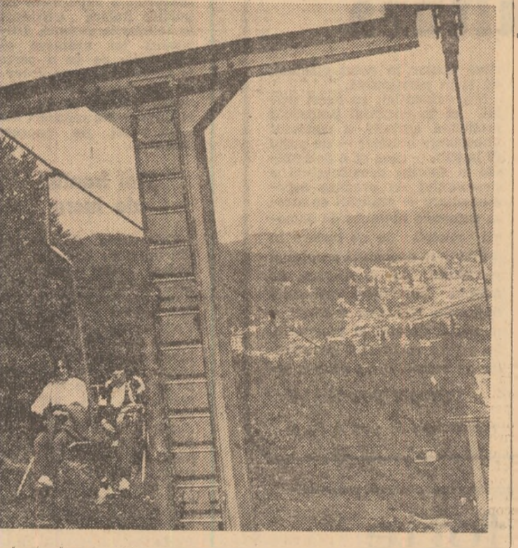
De la Predeal la Clăbucet-plecare, o cale atît de... scurtă, dar plină de neasemuită frumusețe montană.

● Din Teleorman ni se transmite că zilnic, în perioada 7-12 septembrie, peste 260 de tineri din cadrul Intreprinderii de transporturi auto participă la lucrări de recondiționare a pieselor și la repararea mașinilor necesare pentru transportul produselor agricole în campania de toamnă. Valoarea lucrărilor este de aproximativ 800.000 de lei, dar valoarea acțiunii este cu mult mai mare. ● Aflăm că 200 de tineri din 4 comune ale județului Arad participă zilnic la recoltatul floarea-soarelui de pe o suprafață de 25 de hectare și legume de pe 40 de hectare. ● De 20 de ori mai mult tinerii din județul Călărași. ● În cinci consilii unice agro-industriale din județul Prahova, peste 1.500 de tineri s'au implicat în recoltă și sortă legumelor și fructelor. ● Struguri, floarea-soarelui, porumb recolțate zilnic peste 700 de tineri din localitățile Bădăreni și Dăeni din județul Tulcea.