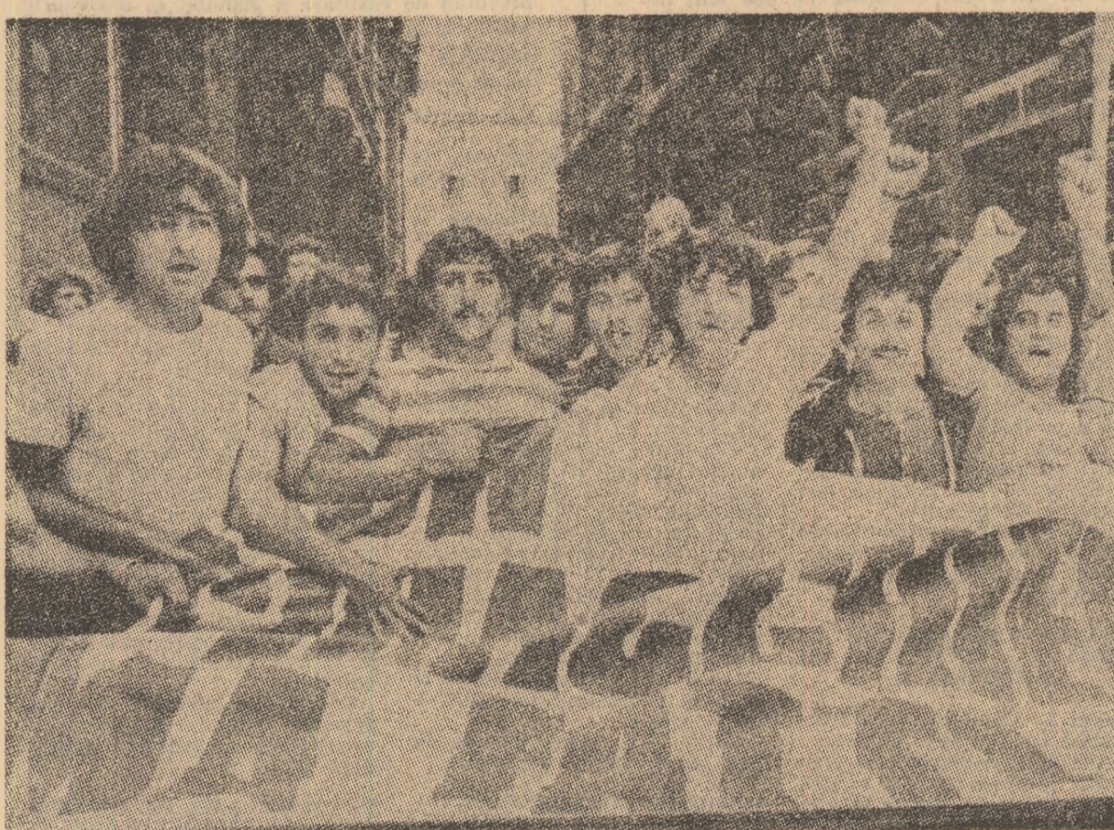
ITALIA — Aspect din timpul unei ample demonstrașii organizate la Roma împotriva creșterii alarmante a șomajului în rîndul tineretului

BUDAPEȘTA 22 (Agerpres). — La Budapeșta au început, la 22 septembrie, convorbirile ungaro-libiene. Delegașia ungară este condusă de Janos Kadar, prim-secretar al C.C. al P.M.S.U., iar cea libiană de Moammer El Gaddafi, conducătorul Marii Revolușii de la 1 Septembrie din Jeddah. În cadrul convorbirilor, Socialiștii care întreprind o vizită oficială în R.P. Ungară. După cum relatează agenșia M.T.I., în cursul convorbirilor au fost abordate problemele principale ale relașilor bilaterale, ambele părți subliniind dorinșele de a le dezvolta în continuare.