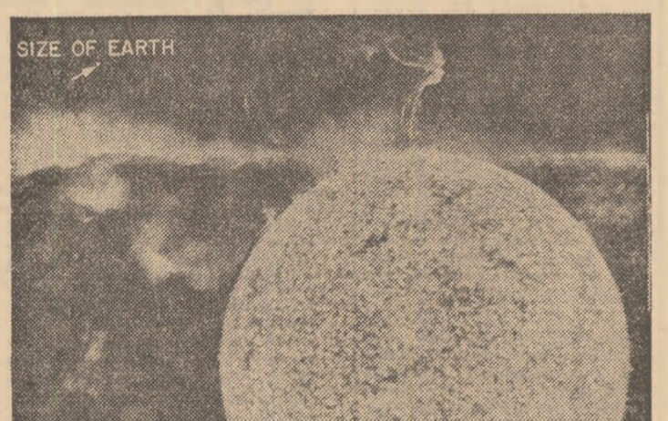
Fotografiat de Skylab 3, o erupție solară care atinge 800.000 km. în stînga sus, Pămîntul

Imensul nor interstelar de gaz și praf, la fel ca și celelalte planete ale sistemului nostru solar. El nu este decît o mică stea. Printre miliardele de astri care formează galaxia noastră, un fenomen bulgăre de gaz îndemnat, o plasmă, cu un diametru de un milion trei sute de mii de kilometri sî-