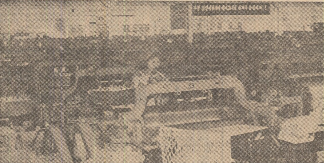
R. P. D. COREEANĂ: Într-o secție a Uzinelor textile din orașul Kaesung