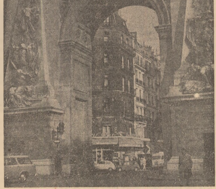
Instytutul reunește pe cei care vor să studieze limba română în cadrul Universității Paris III, unde se află Institutul Național de Limbă Orientală și IVALCO și pe cei de la Universitatea Paris IV — Sorbona.

Clădirea datează din 1635-1642. Ideea este mai veche și rămîne legată de numele lui Robert de Sorbon, venit cu nume cu tot dintr-un sat din Ardeni. Cu ajutorul regel francez din 1253 colegiile în care făcea școală 16 studenți săraci. Prima imprimărie franceză se fi găzduit în Sorbona, la 1469.