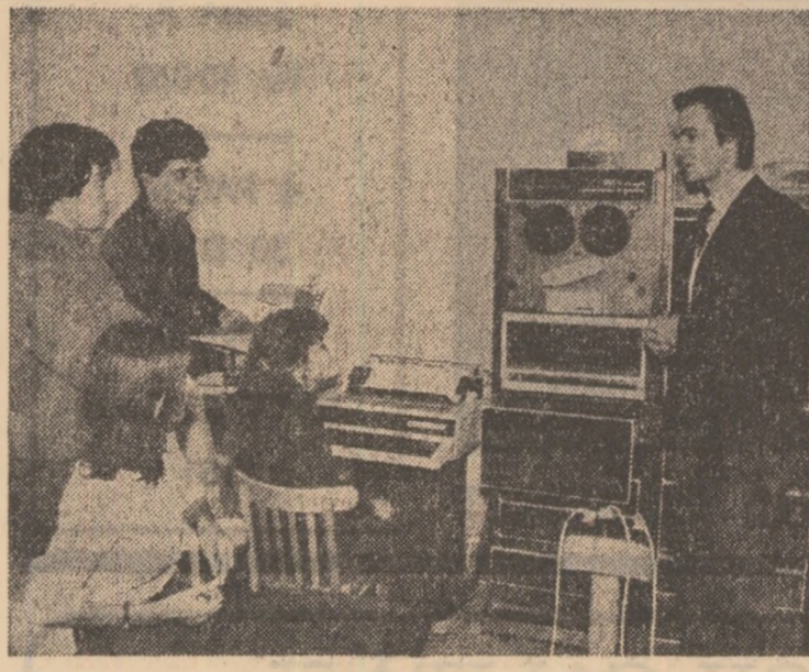
Studentii Facultății de automată în timpul orelor de laborator