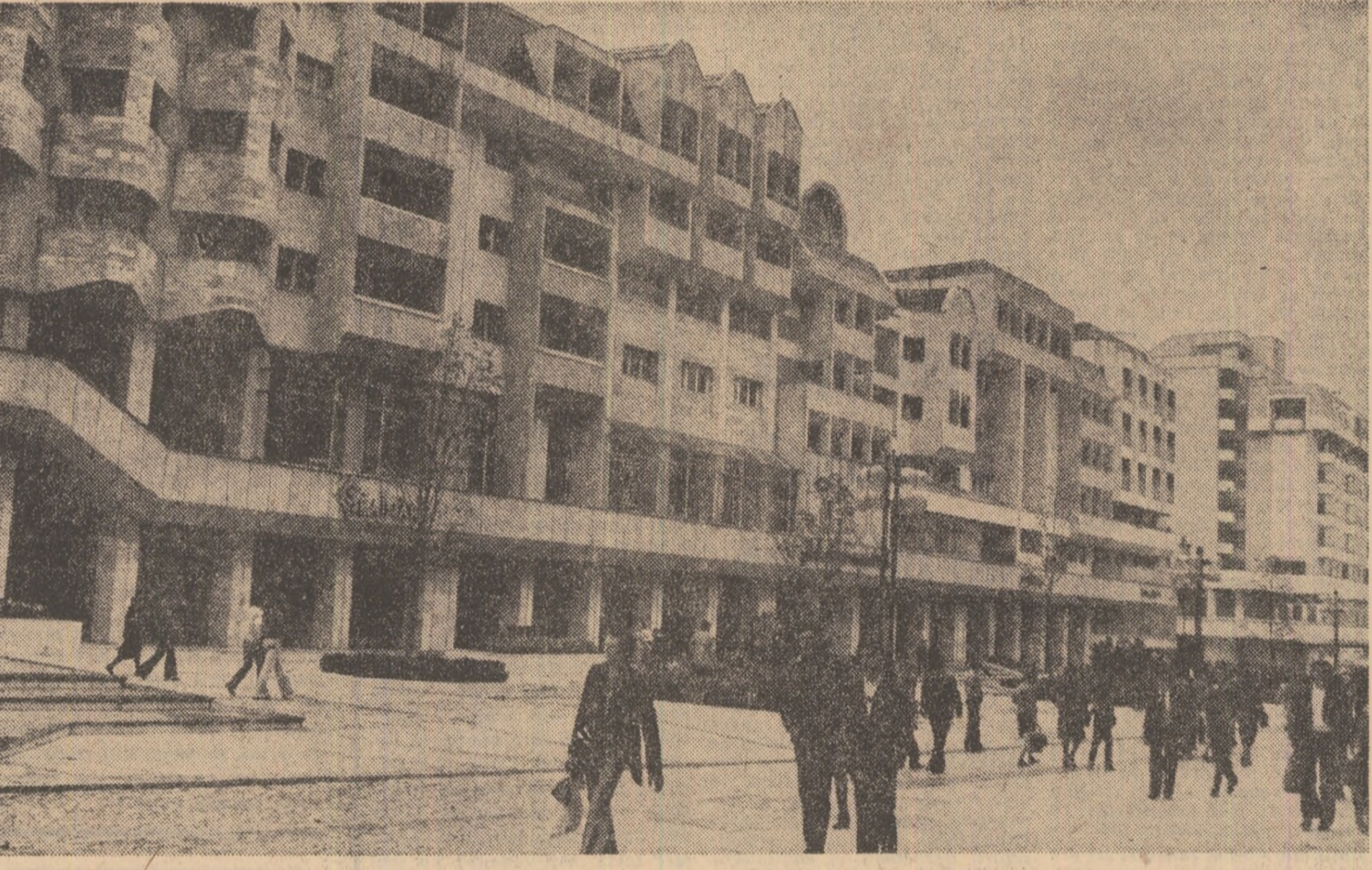
Noua arhitectură a Craiovei, Bulevardul Unirii