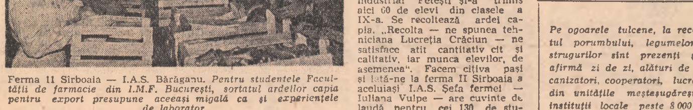
Ferma 11 Sirboala — I.A.S. Bărgănuș. Pentru studențele Facultății de farmacie din I.M.F.A. București, sortatul ardelor — pentru export presupune acasă la ea și experiențele de laborator