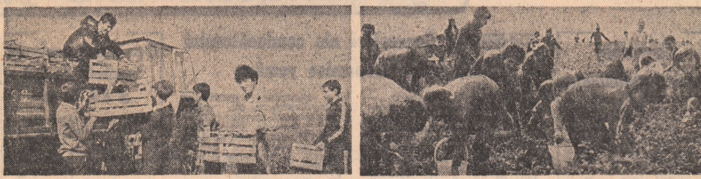
C.A.P. Movila. Încă un mic efort și un nou transport de gogoșari va lua drumul pieței. Ne conving de aceasta elevii Școlii generale din comuna Movila — Ialomița