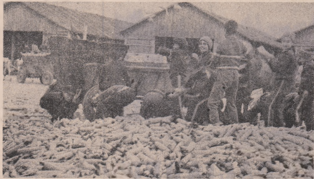
„A FOST CEA MAI SCURTĂ CAMPANIE și în această săptămână încheiem lucrările de însămîntare și recoltare la principalele culturi de toamnă. ESTE ȘI REZULTATUL CONTRIBUȚIEI EFICIENTE A TINERILOR DIN COMUNA NOASTRĂ” ne-a spus primarul și președintele cooperativei din Fălcioiu. Noi o concretizăm prin această imagine în baza de recepție unde elevii ajută acum la depozitarea recoltei

Respectarea fluxului în campania de recoltare a cartofilor în județul Brașov se impune acum mai mult ca oricînd. A ploaie noaptea, ploaia a surprins cartofii recoltați și sortați în câmp, s-a stat aproape trei zile cu ochii pe cer, timp în care elevii și studenții au fost prezenți la lucrările de muncă stabilite, adunînd în continuare, sortînd intruna cartofii, respectîndu-și deci angajamentul asumat de a fi un sprijin de nădejde în actuala campanie.