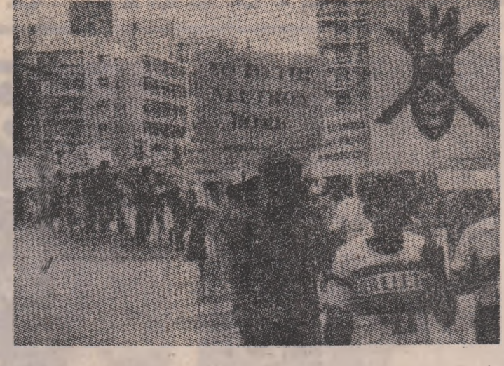
CIPRU. Aspect din timpul unei demonstrații împotriva producerii de noi arme nucleare în lume ce a avut loc recent la Nicosia