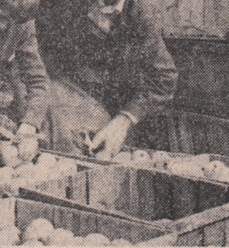
Circa O MIE TONE DE MERE (ultimile din recolta acestui an) vor lua în cel mai scurt timp drumul piețelor și depozitelor de la ferma Iancu Jianu prin contribuția tinerilor din Balș, Slatina și comuna învecinate

La ferma Zaplaz a I.A.S. Rm. Sărat au fost ieri prezenți în podșorul 150 de elevi din cei peste 5 000 de tineri mobilizați de Comitetul orașenesc al U.T.C. în diverse puncte din comunitate, în punctele de la Lăzăr, Zaplaz, împreună cu acest mînușchi de uteciști care au devansat fără drept de apăs normă zilnică. În punctele Chiar și Arman cunoscute de fiecare ca propria palmă, după mîrșirile ing. Andrieu Isiofache, șeful fermei, via este deja culeasă. Planul de 8 750 kg la hectar a fost cu mult depășit, în unele zile producția înregistrată însumînd 11 000 kg la hectar.