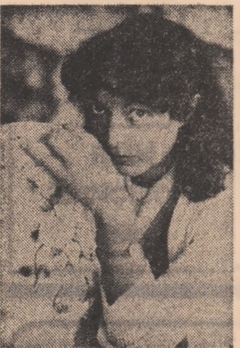
Frumusețea — ca permanentă a muncii sau plămîna Craza de la „Porțelanul“ Alba Iulia: alături de ultima ei realizare.

data asta cu bucuria că avem prilejul să relatăm despre reluarea unei vechi inițiative a comitetului U.T.C. de aici: participarea tinerilor la revizii tehnologice. În aceste zile un număr de 100 tineri verifică instalațiile de pilozită și fenol, repară utilajele și curăță coloane și recipientii. Datorită contribuției tineretului, instalațiile vor intra în funcțiune cu două zile mai devreme. ■ Tinerii din trei întreprinderi buzoiene (Întreprinderea de sîrmă și produse din sîrmă, Întreprinderea de prelucrare a materialelor plastice și Întreprinderea de gemuri) au o bună acțiune de educație economică intitulată „Producția netă — eficiența muncii noastre“. Fată ce realizează ei peste plan în aceste zile de început de octombrie: 100 tone sîrmă, 40 tone pîșe pentru tractoare, 200 metri gem, 10 tone polietilenă. O muncă eficientă!