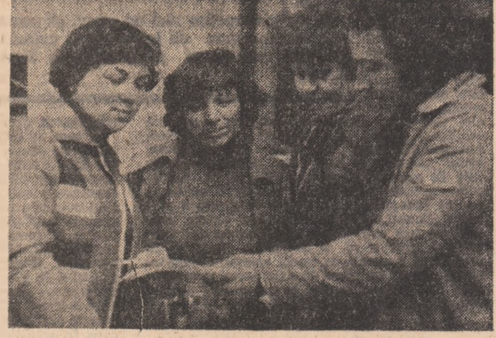
„Comandamentul“ organizației U.T.C. din comuna Smeeni — Buzău într-o dimineață de campanie

■ Am scris nu de puține ori despre tinerii de la Combinatul petrochimic Brazi. Scriem și de