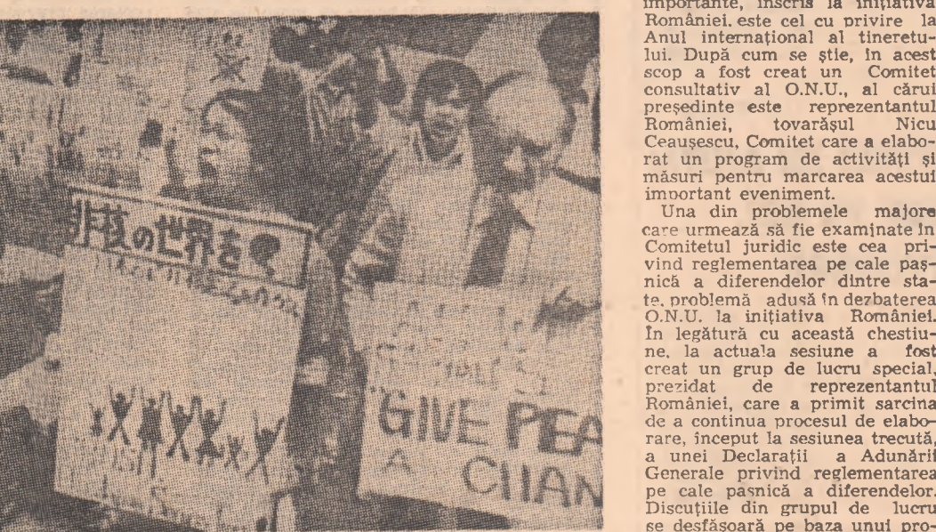
JAPONIA: Aspect din timpul unei demonstrații desfășurate la Tokio împotriva cursei înarmărilor nucleare

La Moscova au fost date publicității chemările C.C. al P.C.U.S. cu prilejul celei de-a 64-a aniversări a Marii Revoluții Socialiste din Octombrie