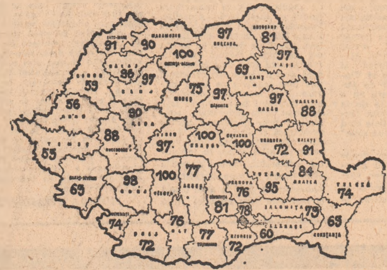
*) În seara zilei de 13 octombrie, județul Bacău a raportat încheierea însămînțării

SITUAȚIA ÎNSĂMÎNȚĂRII GRIULUI ÎN COOPERATIVELE AGRICOLE DE PRODUCȚIE (în procente)