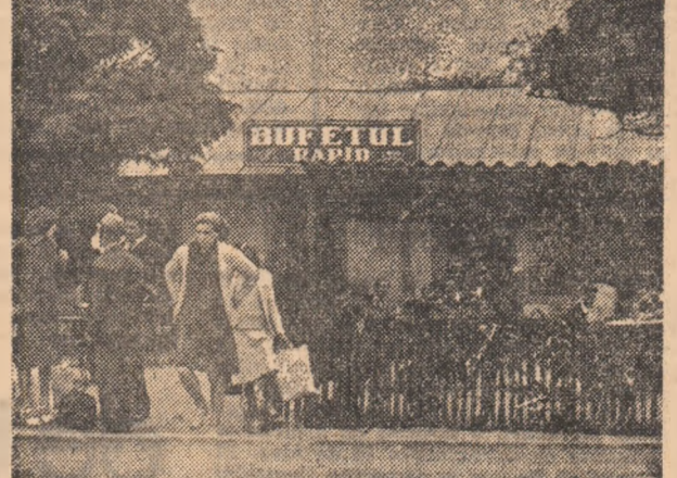
...sau au treburi urgente la bușetul-rapid