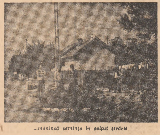
...mănușcă semințe în colțul străzii