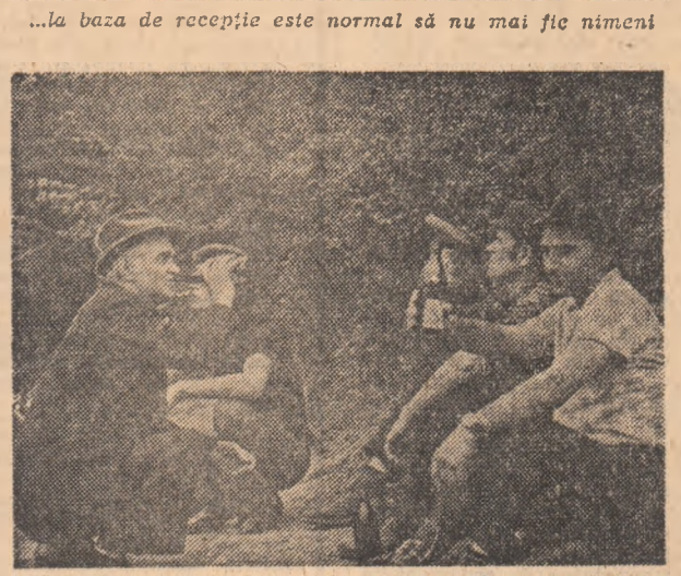
...pentru că oamenii, după tulburare, se mai dreg și cu o bere