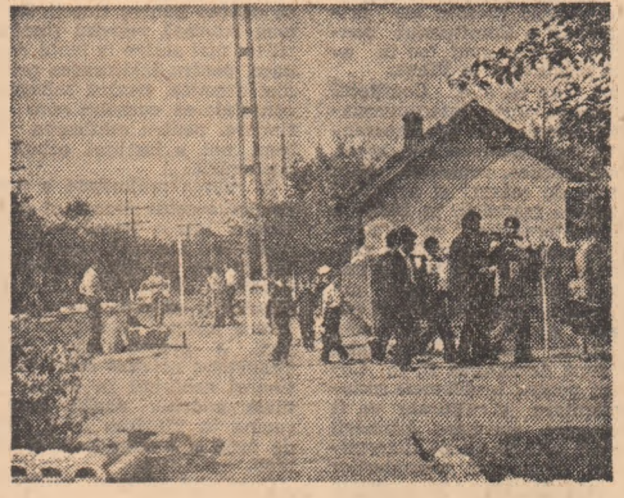
Cind in sat e nuntă mare...