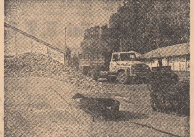
...la baza de recepție este normal să nu mai fie nimeni