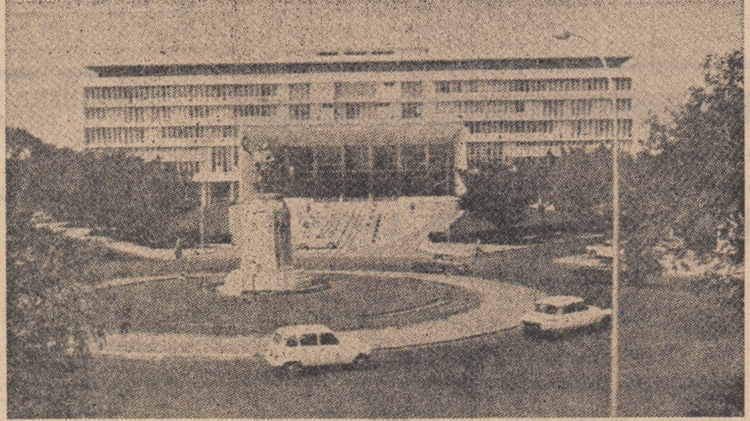
Imagine a sediului Adunării Naționale a Senegalului, edificiu cu arhitectură modernă înaltă în capitala țării, orașul Dakar

Desemnarea lui Mohamed Husni Mubarak în funcția de președinte al R.A. Egipt este un prilej de a evoca bunele relații, pe multiple planuri, de colaborare româno-egiptene, legăturile de prietenie, cu vechi și bogate tradiții, dintre popoarele noastre. Este binecunoscut că, în cadrul politicii sale externe principale, România a acordat și acordă o deosebită însemnătate dezvoltării concurenței multilaterale cu popoarele arabe, a căror luptă pentru progres economic și social, pentru consolidarea independenței naționale și pacei, este o cauză de solidaritate fermă a poporului român. În cadrul acestei orientări, raporturile de concurență dintre România și R.A. Egipt — puternic stimulate de întîlnirile și con-