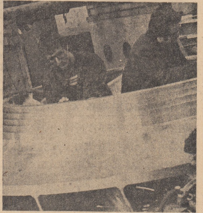
Tineri de la I.M. Reșița în întrecere

Intimpinând apropiata „Zi a energieticianului”, colectivul de constructori de pe șantierul hidrocentralei de la Răcăciuni, județul Bacău, se află într-o susținută întrecere de muncă. Pînă în prezent, volumul total al lucrărilor de excavatii și umpluturi depășește 2 000 000 metri cubi. Un succes deosebit al oamenilor muncii de aici îl constituie atingerea cotei maxime a digului, de 18 metri înălțime, în condiții de cea mai bună calitate. La fel de laudabilă este realizarea, înainte de termen, a podului tehnologic din apropierea centralei hidroenergetice, urmare a devierii abției Siretului. Prin aceasta s-a scurtat cu mai bine de 20 de km distanța pentru transportul de materiale și utilaje, precum și pentru deplasarea forței de muncă.