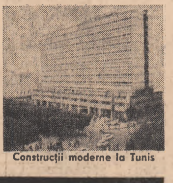
Construcții moderne la Tunis

MOSCOVA 20 (Agerpres). — Leonid Brejnev, secretar general al C.C. al P.C.U.S., președintele Prezidiului Sovietului Suprem și U.R.S.S., l-a primit, marți, pe Yasser Arafat, președintele Comitetului Executiv al Organizației pentru Eliberarea Palestinei, aflat într-o vizită la Moscova. În cursul convorbirii desfășurate cu acest prilej — relatează agenția TASS — s-a efectuat un schimb de vederi asupra unui cerc larg de probleme referitoare, în primul rînd, la situația din Orientul Mijlociu.