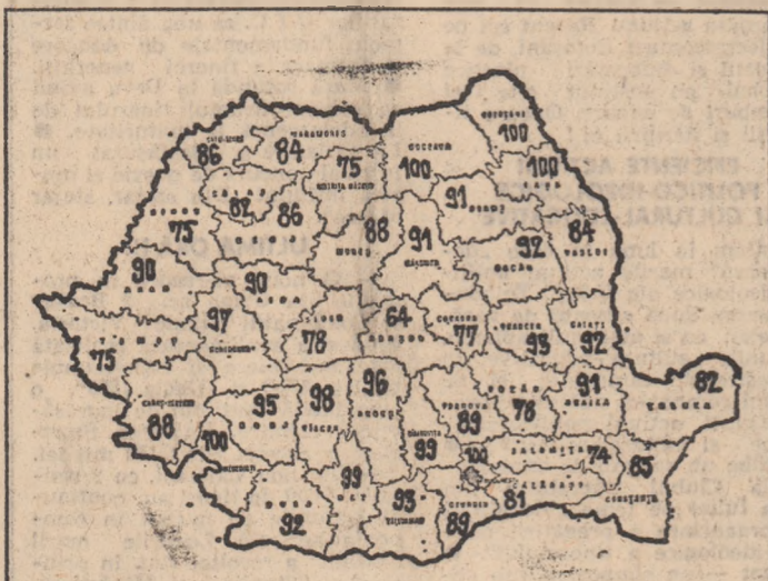
Situația recoltării porumbului în C.A.P. (în procente)