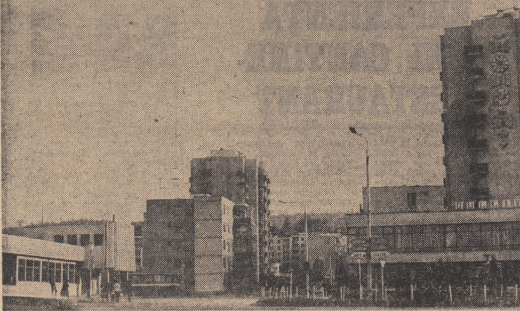
Nova arhitectură a orașului Zalău