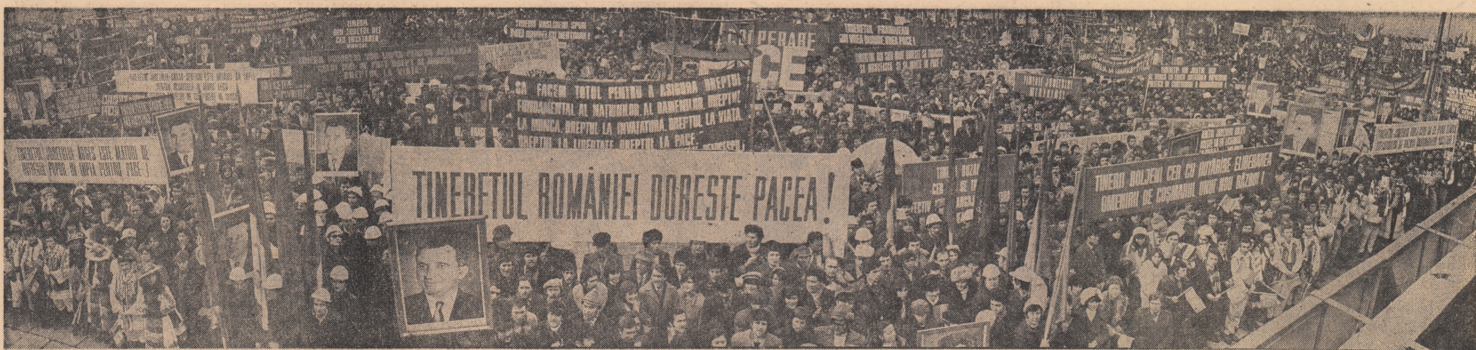
CITIȚI ÎN PAGINILE 2-3-4 reportajul de la grandioasa manifestare desfășurată sîmbătă în Capitală