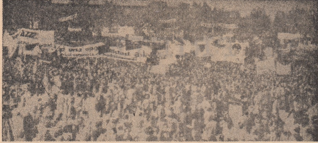
Impresionaţi amplasor pe care o cunoaşte, în numeroase ţări manifestările în favoarea păcii, împotriva războiului, este exprimată sugestiv şi de această imagine din timpul „Marşului păcii” desfăşurat la Madrid