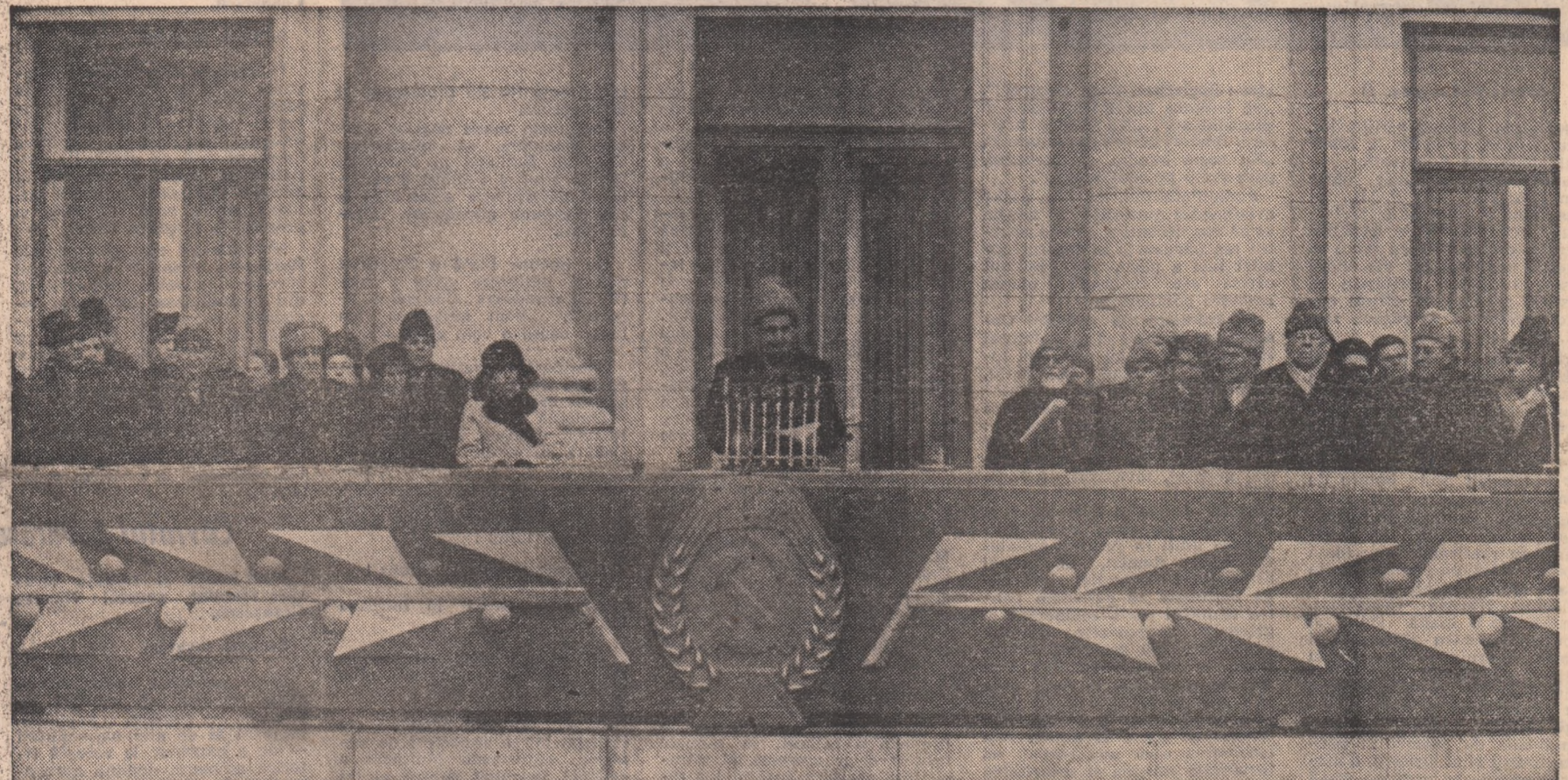
(Continuare în pag. a II-a)