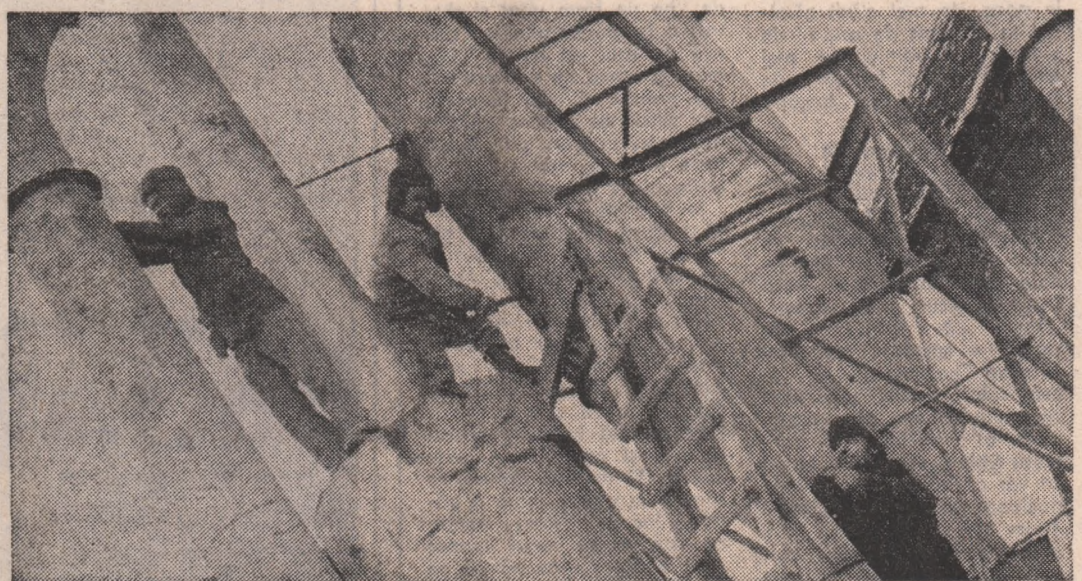
Pe șantierul de investiții al Fabricii de nutrețuri combinate din Chirnoși