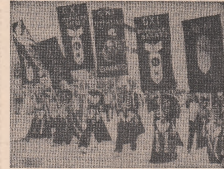
Pe străzile Atenei s-a desfășurat o amplă demonstrație împotriva cursei înarmărilor, participanții scandînd: „Nu, morții atomice!”

În Japonia, ziarul „Akahata”, organ al Partidului Comunist Japonez, a publicat un amplu articol referîndu-se la declarațiile lui Nicolae Ceaușescu, în care sînt menționate inițiativele de pace ale președintelui României, arătîndu-se că la marea adunare populară de la București, președintele Nicolae Ceaușescu a rostit o amplă cuvîntare, iar multimea a scandat în repetate rînduri „Ceaușescu-Pace”.