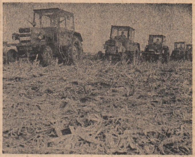
In pagina a 3-a

In unele unități zootehnice brașovene MINUSURI LA BALANȚA FURAJERĂ, LA PRODUCȚIA DE LAPTE, DAR MAI ALES, LA... SPIRITUL GOSPODĂRESC