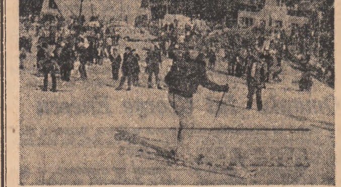
Dați pentru not, bucurestienii, acest an timp mai poate fi numit încă o toamnă tîrzie, la Prudet este de acum sezonul schiului și al sîniușului