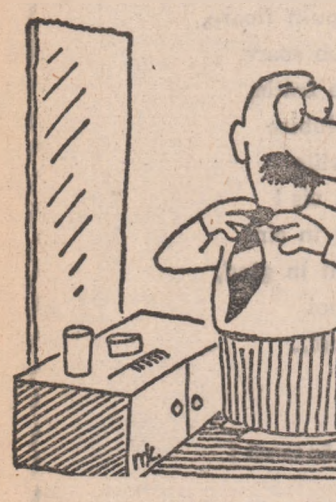
Desen de MIHAI MATEI