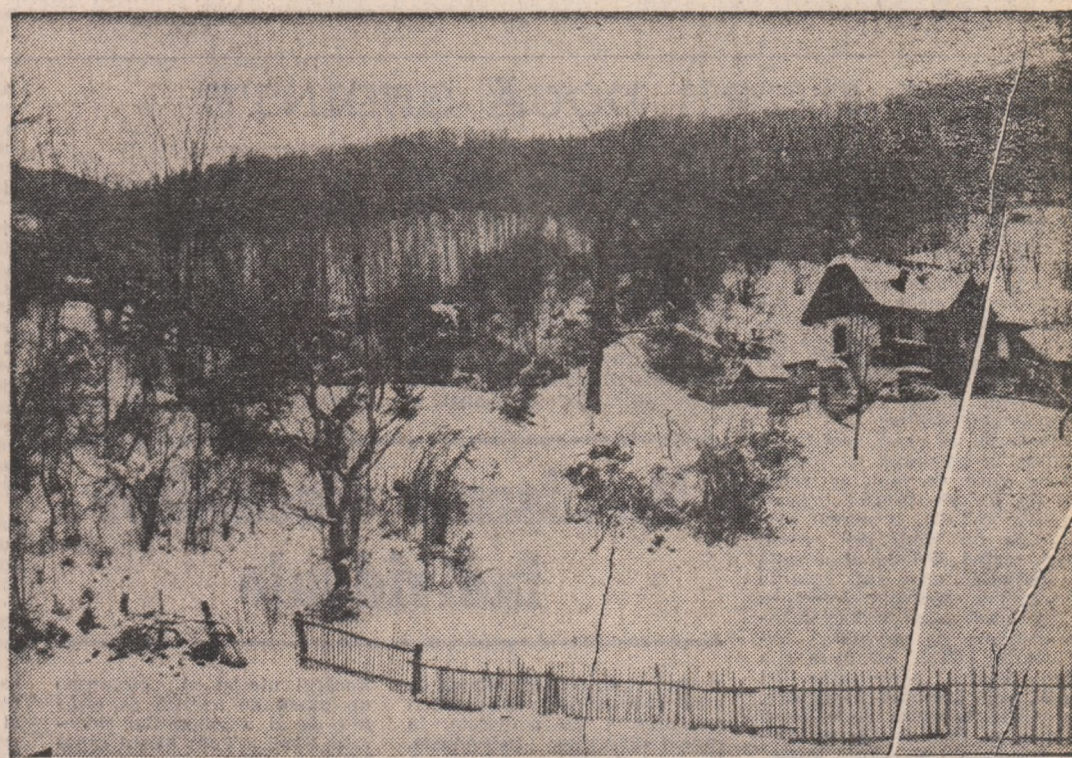
România de azi — repere pentru un nou destin

ANUL XXXVII, SERIA II, Nr. 10 132 4 PAGINI 30 BANI MIERCURI 23 DECEMBRIE 1981