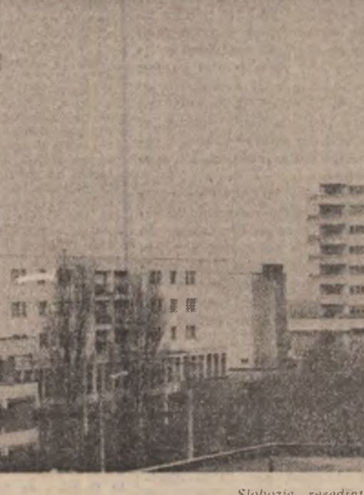
Slobozia, reședința județului Ialomița