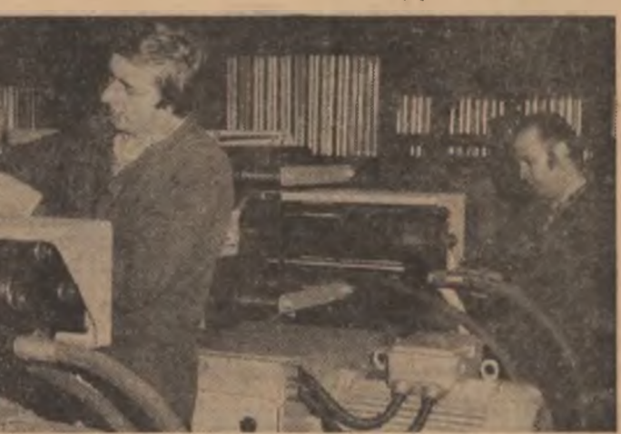
R.S. CEHOSLOVACA: Imagine din una din secțiile întreprinderii Vihorlat din orașul Mihalovca

FELIPE GONZALES, secretar general al Partidului Socialist Muncitoresc Spaniol, a avut, la Washington, o întreviere cu secretarul de stat, Alexander Haig, în cursul căreia a fost abordată situația politică din America Centrală și zona Caraibelor. Informază agenția E.F.E. Felipe Gonzales a declarat după întreviere că „S.U.A. împărtășește părerea că este necesar să se găsească soluții politice și negociate” la problemele din această regiune.