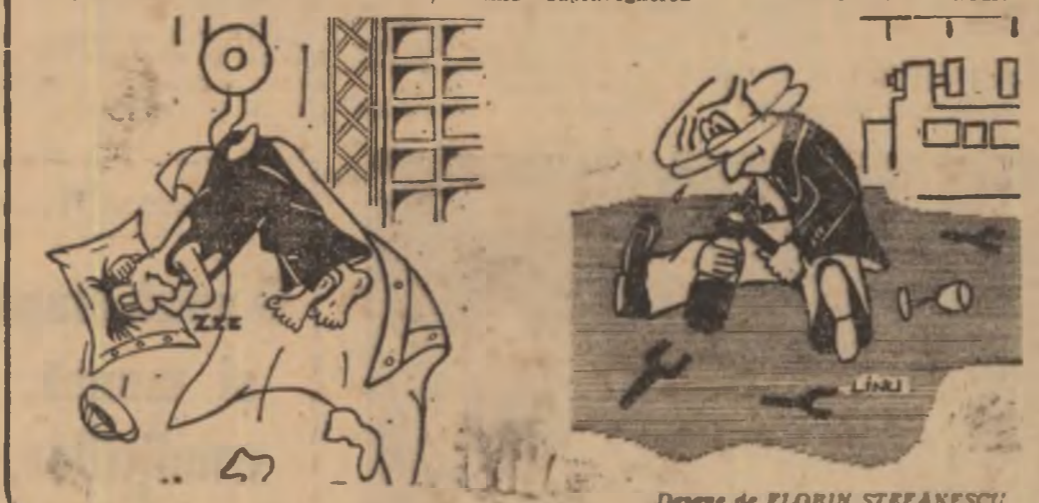
Desena de FLORIN ȘTEFĂNESCU