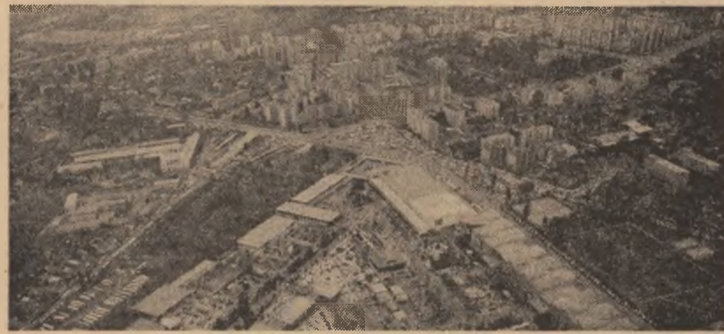
R. S. F. IUGOSLAVIA — Imagine panoramică a orașului Novi Sad