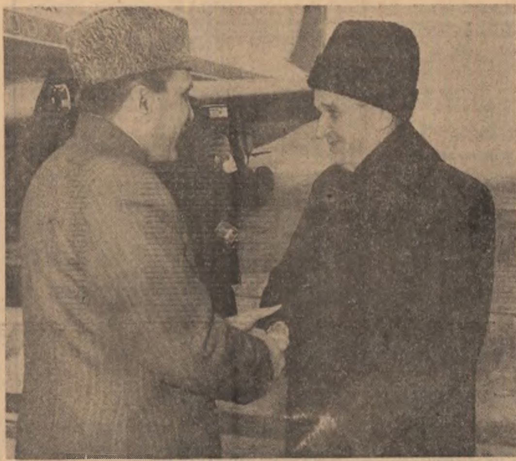
(Continuare în pag. a III-a)

portretele președintelui Nicolae Ceaușescu și președintelui Mohammad Zia-ul Haq, încadrate de dramele de stat ale României și Pakistanului. Pe mari pancarte erau înscrise urările: „Bun venit în Republica Socialistă România excelenței sale general Mohammad Zia-ul Haq, președintele Republicii Islamice Pakistan!” și „Să se dezvolte continuu raporturile de prietenie și cooperare dintre Republica Socialistă România și Republica Islamică Pakistan, în interesul ambelor popoare, al cauzei generale a păcii, înțelegerii și securității în lume!”. În întâmpinarea înaltului oaspete pakistanez au venit tovarășii Nicolae Ceaușescu și tovarășa Elena Ceaușescu. Pe aeroport erau prezente tovarășii Ilie Verdet, Gheorghe Oprea, Cornelia Filipas, Gheorghe Pană, Ștefan Andrei, Ana Muresan, Constantin Olteanu, precum și membri ai guvernului, generali. Au fost de față Constantin Burada, ambasadorul României la Islamabad, și Iqbal Hosain, ambasadorul Pakistanului la București. La ora 16.00 aeronava cu care călătorit înaltul sol al poporului pakistanez a aterizat. Tovarășul Nicolae Ceaușescu a salutat cordial pe generalul Mohammad Zia-ul Haq în coltul internațional Otopeni. Pe frontispiciul aerodromului se aflau