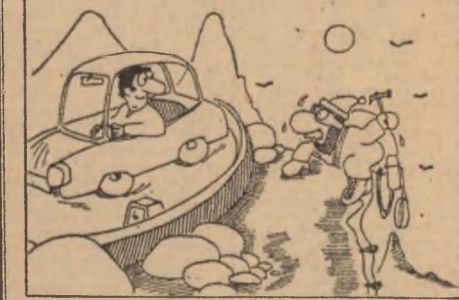
Desen de MIHAI MATEI Rubrică realizată de V. RĂVESCU