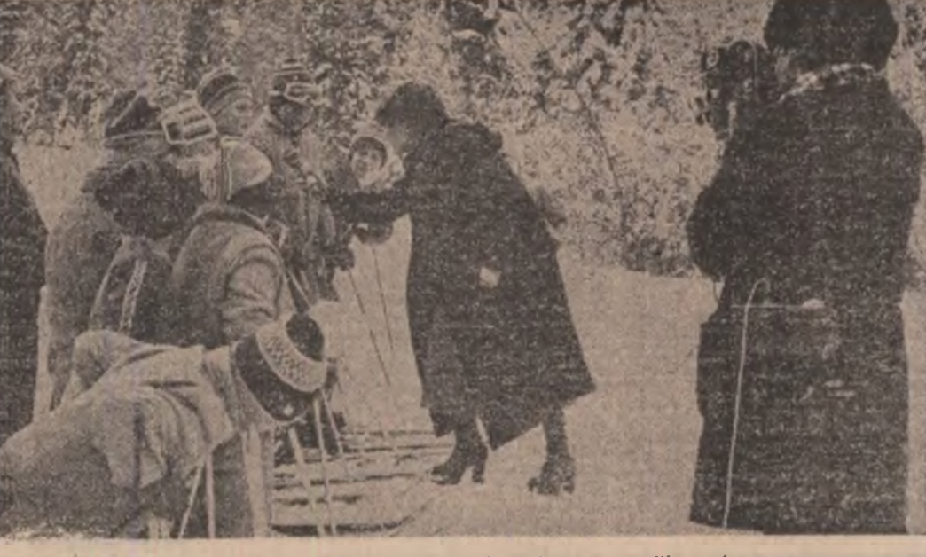
Primul concurs oficial, primul interviu și prima filmare!