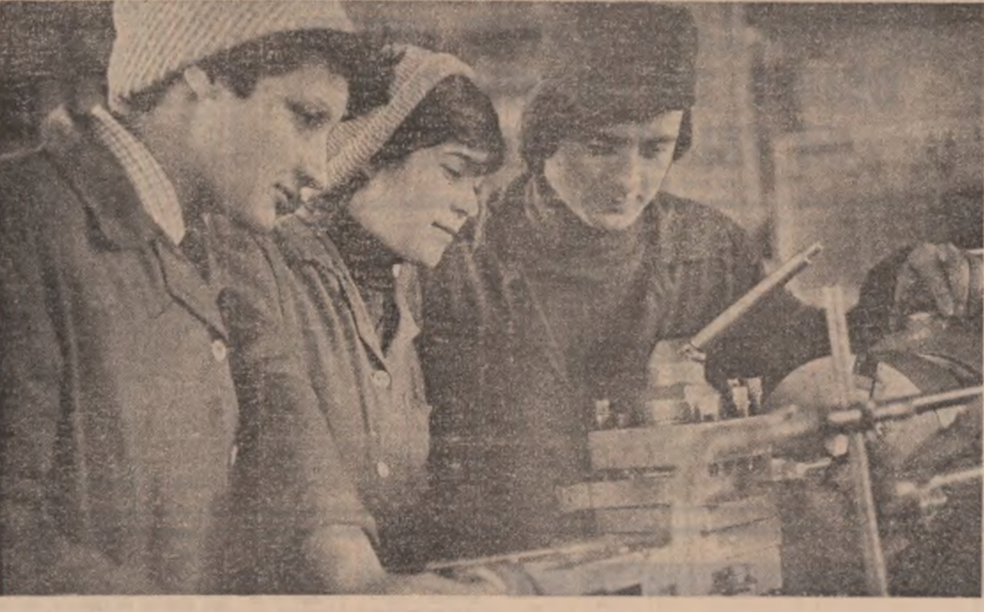
O nouă generație muncitorească se formează în amfiteatrele înalte lor răspunderi de la Șantierul naval din Giurgiu