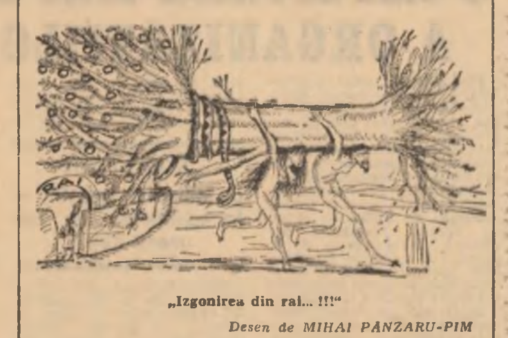
„Izgonierea din rău... !!!”

Deși spațiul nu ne îngăduie să reproducem decit o mică parte din scrisorile solite la redacție sîntem incredibilul totuși că am avut un prim exemplu concludent despre profunzimea omeniului, despre spiritul de înțelegătorie și dreptate cu care oamenii de cele mai diverse vîrste și profesii se simt răsunători pentru a ocroti vîlșii și conștiințe frăgile. Așa cum am promis în primul material în măsura în care organele procuraturii își vor încheia investigațiile și se va stabili o concluzie fermă, vom informa pe larg cititorii noștri asupra cazului. Pînă atunci, așteptăm în continuare opiniile dumneavoastră, stimăți cititori.