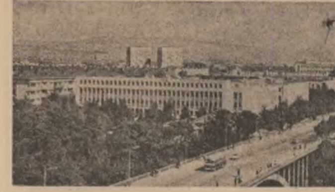
R.S.F. IUGOSLAVIA: Imagine din Titograd, oraș aflat în continuă dezvoltare social-economică

februarie, la Paris, cu ministrul relațiilor externe al Franței, Claude Cheysson, informează agenția poloneză de știri PAP. În cursul convorbirilor au fost examinate probleme de interes comun, inclusiv cele abordate în negocierile externe ale Consiliului militar pentru sal- vare națională, în scrisorarea adresată lui Francois Mitterrand, președintele Franței — arată agenția P.A.P. ● GUVERNUL de reconstruc- ție națională din Nicaragua a anunțat de la dețurarea unui plan con- revoluționar în regiunea in- dierilor Misquitos, la frontiera cu Honduras, vizînd separarea coastei atlantice de restul țării.