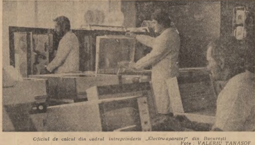
Oficiul de calcul din cadrul întreprinderii „Electroaparatoj” din București

Economia de la o săptămînă la alta In pagina a 3-a O înaltă datorie față de societate, față de noi înșine SĂ TRĂIM ȘI SĂ MUNCIM SUB SEMNUL EXIGENȚELOR ETICII ȘI ECHITĂȚII SOCIALISTE In pagina a 2-a