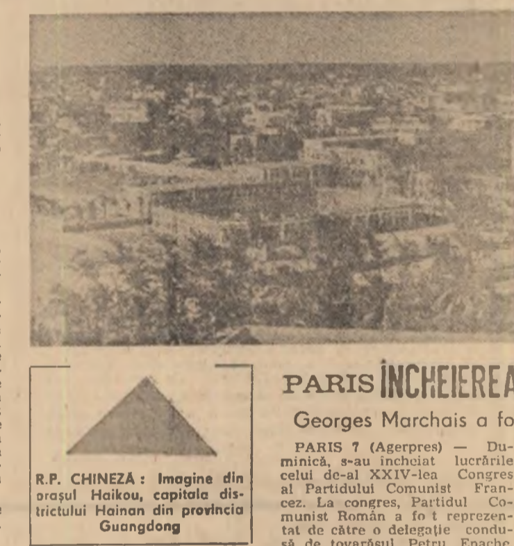
R.P. CHINEZA: Imagine din orașul Haikou, capitala districtului Hainan din provincia Guangdong

WASHINGTON 7 (Agerpres). — Pe străzile și în pietele orașului american San Francisco au răsunat din nou lozinci în favoarea păcii.