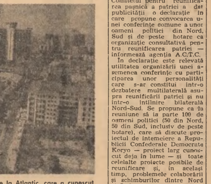
Imagine din Lagos, capitala Republicii Federative Nigeria, orașul-port de la Atlantic, care a cunoscut o impetuoză dezvoltare în ultimii ani

PRETORIA 11 (Agerpres). — Sute de mii de studenți și muncitori negri și albi din Republica Sud-Africană au adus joi un omagiu lui Neil Aggett, lider sindical albi, mort săptămîna trecută în detenție. Neil Aggett, medic în vîrstă de 28 de ani, fusese arestat în noiembrie 1961, în baza așezărilor legale contra terorismului, care autorizează o detenție nelimitată, fără încalcare sau proces, în izolare totală. Potrivit versiunii autorităților rasiste de la Pretoria, dr. Aggett a fost găsit spânzurat în celula sa, săptămîna trecută.