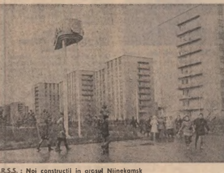
U.R.S.S.: Noi construcții în orașul Niņekamsk