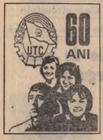
60 ANI UTC