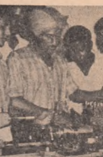
INDIA: Imagine dintr-un centru de pregătire a cadrelor pentru industrie din Delhi

DESFĂȘURATE într-o atmosferă caldă, tovarășească, convorbirile au prilejuit evidențierea, de ambele părți, a dorinței de a