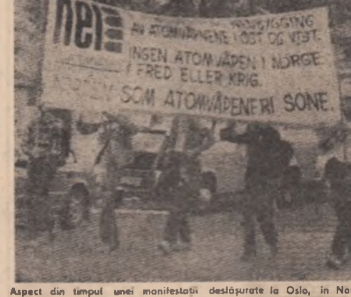
Aspect din timpul unei manifestații desfășurate la Oslo, in Norvegia, împotriva preconizatei amplasări a unor noi rachete nucleare in Europa

ROMA 7 (Agerpres). — Potrivit unui bilanț oficial, dat publicității la Roma și reluat de agenția ANSA, in ultimele două luni poliția italiană a dat lovitură serioasă terorismului, arestind 290 membri ai grupurilor teroriste, in primul rind al „Brigăzilor roșii“. Totodată, poliția a descoperit, in perioada menționată, peste 50 de ascunzătoare ale teroristilor, confiscând considerabile cantități de arme de foc și muniții. Acest bilanț, subliniază agenția citată, este rezultatul unei ample campanii antiteroriste efectuate de la începutul acestui an. Pe de altă parte, se menționează că a fost identificat cel mai mare arsenal al teroristilor, așa-zisul „arsenal strategic“ al „Brigăzilor roșii“, amplasat într-o grădă din Sardinia și in care se aflau mii de rachete antitanc, rachete sol-aer, muniții, grenade și material exploziv.