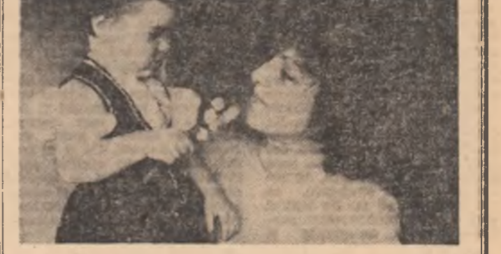
Flori, cele mai sincere flori pentru cele mai curate sentimente pe care le exprimă gestul pentru mama sa