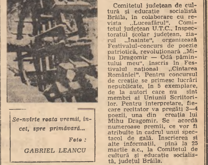
Se-nfirte roata vremii, ințet, spre primăvară...

Comitetul județean de cultură și educație socialistă Brăila, în colaborare cu rețeaua „Lucafeărul”, Comitetul județean U.T.C., Inspectoratul școlar județean, ziarul „Înainte”, organizează Festivalul-concurs de poezie patriotică, revoluționară. Măi numărăm artiștii, ce vor fi atribuite în cadrul unui spectacol de gală. Inșcrierea și alte informații, pînă la 25 martie a.c., la Comitetul de cultură și educație socialistă, județul Brăila.