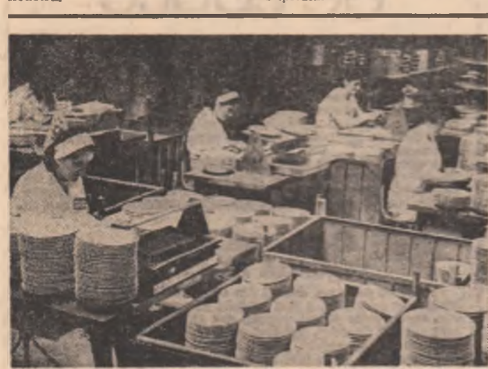
Un nou lot de produse urmează a fi expedit de la Întreprinderea „Porțelanul” din Alba Iulia.

În perioada 15-22 martie, o delegație de activiști al Partidului Comunist al Uniunii Sovietice, condusă de tovarășul Diatlov I. P., adjunct al șefului Secției Construcții a C.C. al P.C.U.S., a efectuat, la invitația C.C. al P.C.R., o vizită pentru schimb de experiență în țara noastră.