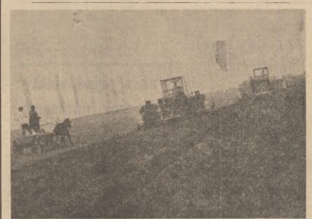
Lucrări de însămânțare cartofilor la C.A.P. Scutelnici, județul Buzău.