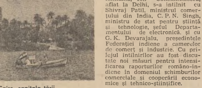
EGIPT: Imagine din Cairo, capitala țării