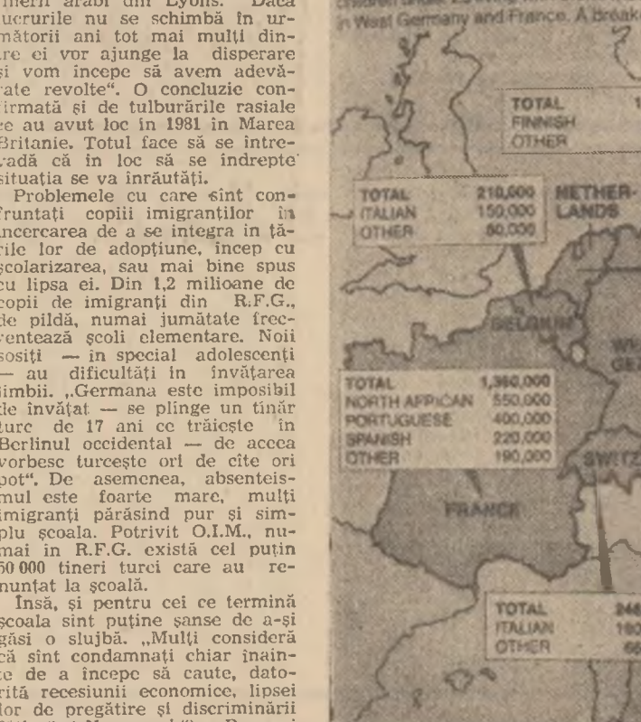
Repartiția pe țări a celor peste 4 milioane de copii ai imigranților potrivit Organizației Internaționale a Muncii